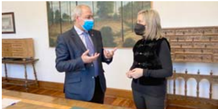
O presidente da Deputación e a alcaldesa, na firma do convenio

OUTROS CONVENIOS. O Concello asinou tamén outros tres convenios