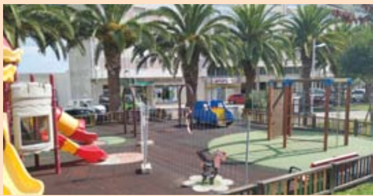
Un dos parques de Burela

VIDEOCLIPS. Burela organiza o I Certame Galego de Vídeos Musicais no que poderán participar as escolas de música, conservatorios e centros de ensino musical. No certame, que se denomina Music@rte, concederanse catro premios, cuxa contía se está a perfilar neste momento ao igual que as bases. O prazo de presentación rematará a mediados de xuño e cada centro poderá enviar un máximo de cinco.