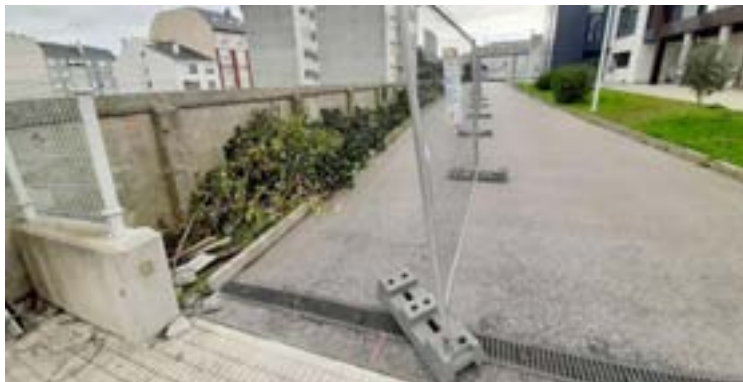
Comezo das obras do acceso da nova residencia

Así, destaca a hidrolimpeza da rúa Escura e do calexón da Viela, colo-