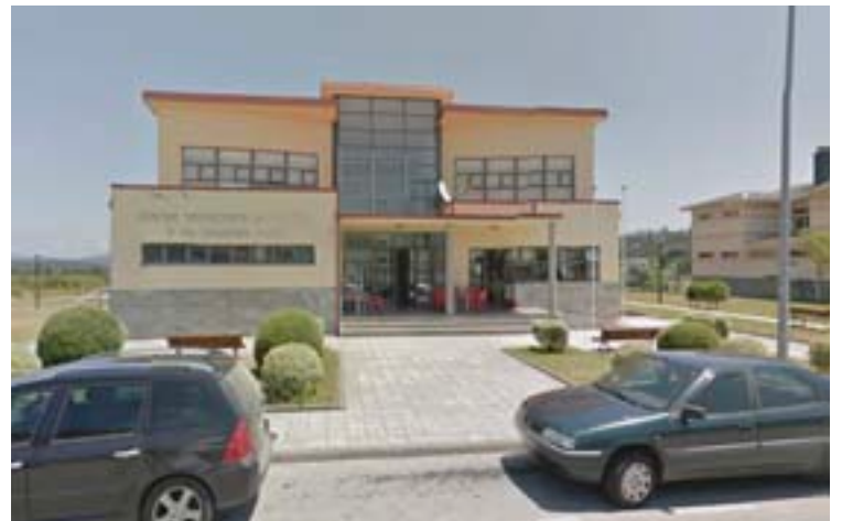
Centro social de Alfoz

As localizacións onde se farán son Gatofero, A Grela, O Rizal, A Cruz e Pazos (na Lagoa); Acivro, Faián de Abaixo, A Croa e Rozas (O Pereiro); Río das Donas, na parroquia de Oiras, As Leas, Canaledo e O Castriñón, en Baco; Barral, Santa Mariña, Correlos e O Liñar (A Granda), en San Pedro de Mor e A Orden, en Adelan. Así mesmo, continuarán con traba-