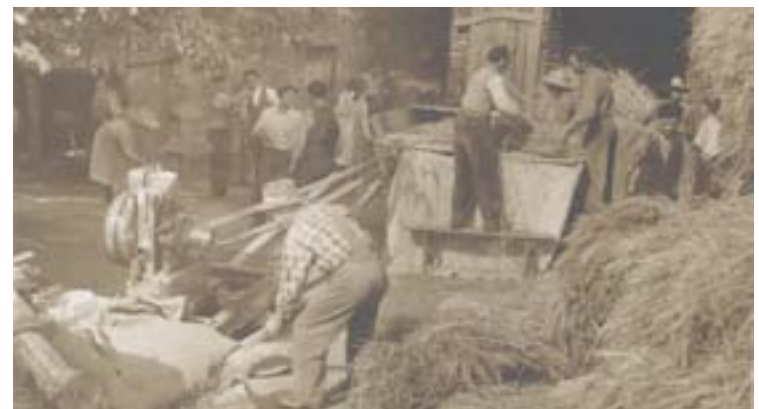
Unha das imaxes antigas do banco

Esta iniciativa formativa e interactiva está dirixida especialmente aos maiores, aínda que está aberta a todas as persoas que queiran participar, xa que os seus contidos poden interesar a calquera cidadán, independentemente da súa idade. Deste xeito, facilítase unha nova vía para que os maiores, que en moitos casos viven sós, poidan seguir en contacto nestes tempos