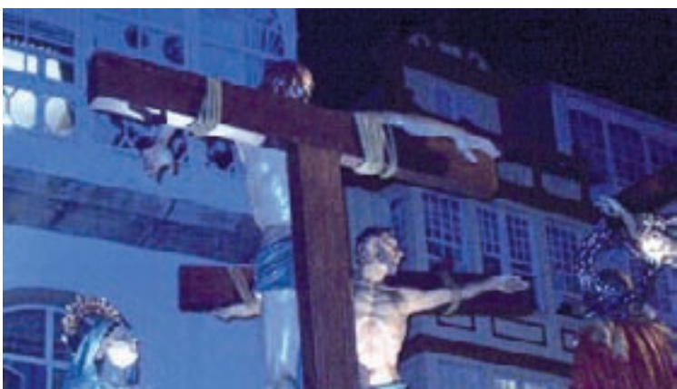
As sete palabras