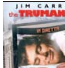
O Show de Truman