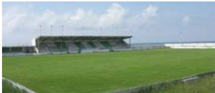
Campo da Marosa