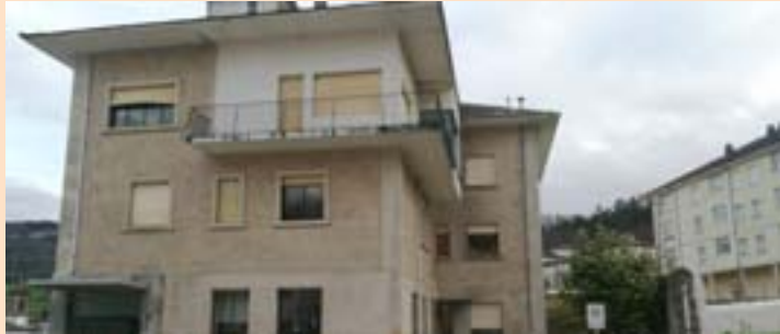
O edificio amañado do Hospital de Cabanela

Escriturouse xa a venda do edificio do antigo hospital de Cabanela á Fundación Educativa e Social Dignidade. Deste xeito remata o expediente publicado o 19 de outubro do ano pasado. O edificio foi adxudicado en 455.271,50 euros.