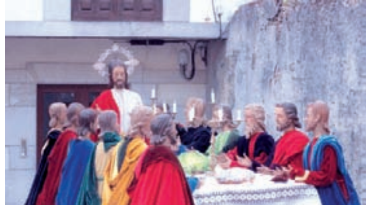
De esquerda a dereita, unha imaxe da procesión do Cristo da Vera Cruz, a Virxe do Camiño da Luz e o paso da Derradeira Cea