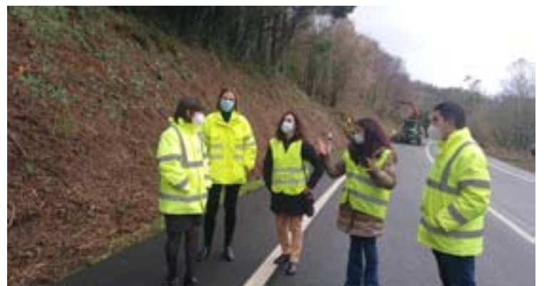
A subdelegada do Goberno, supervisando o resultado dos traballos

A subdelegada do Goberno, Isabel Rodríguez, informou da finalización dos traballos realizados polo Ministerio de Transportes, Mobilidade e Axenda Urbana para aumentar a visibilidade e mellorar a seguridade viaria na estrada N-634 ao seu paso por Mondoñedo.