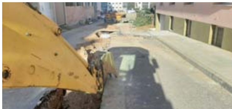
Comezo das obras na rúa Julia Minguillón

O Concello iniciou as obras de urbanización e mellora de accesibilidade na rúa Julia Minguillón, que serve de conexión entre Corporacións Municipais e Cervantes -prolongación da Avenida de Asturias- e soamente contaba con beirarrúas na metade da súa lonxitude, presentando tamén un firme en moi mal estado de conservación.