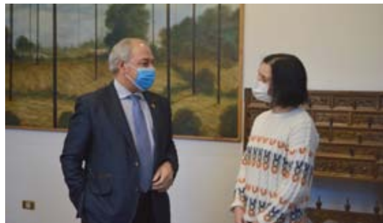
Firma do convenio para as obras da cuberta do teleclub de Sante

TELECLUB DE SANTE. A Deputación colaborará coas obras para o acondi-