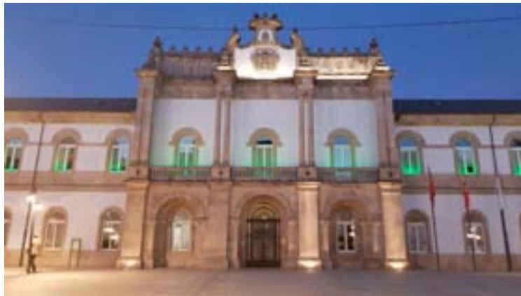
Imaxe da fachada da Deputación, iluminada en verde contra o cancro