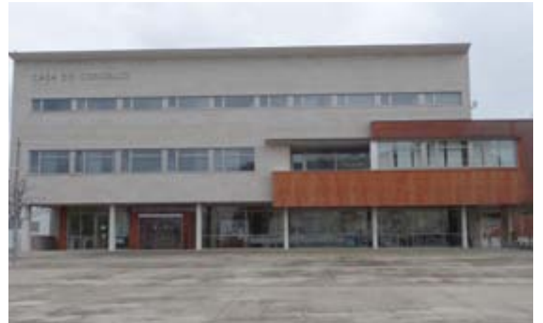
Concello de Burela

O programa de actividades turísticas vai concentrado nas rutas xeolóxicas. A administración electrónica tamén