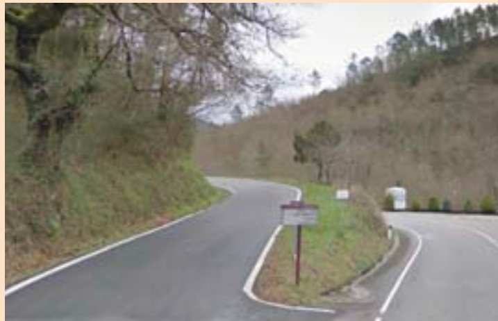
Entrada á estrada que vai a Bouloso e Figueirúa

A transferencia tramítase de acordo co previsto na Lei 8/2013, do 28 de xuño, de estradas de Galicia, que establece a súa aprobación por decreto da Xunta, a proposta da consellería competente en materia de estradas, e logo do