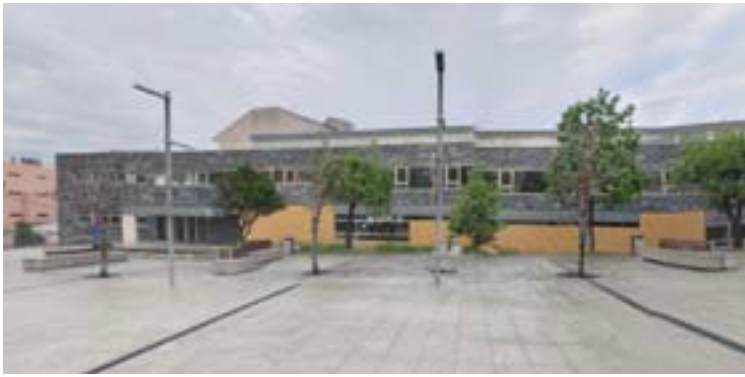
Centro de saúde de Burela