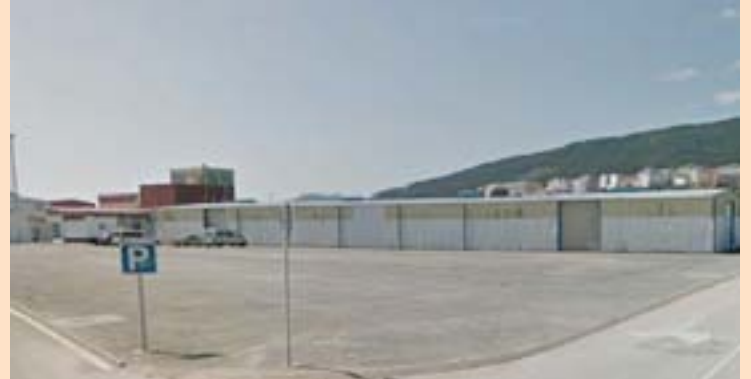
Unha vista da nave de redes de Burela

Para corrixir as actuais deficiencias que presenta este espazo, está previsto cambiar a chapa metálica da cuberta, incluídas novas baixantes e canlóns para evacuar as augas pluviais; e tamén a da fachada, que será substituída por paneis prefabricados de formigón armado.