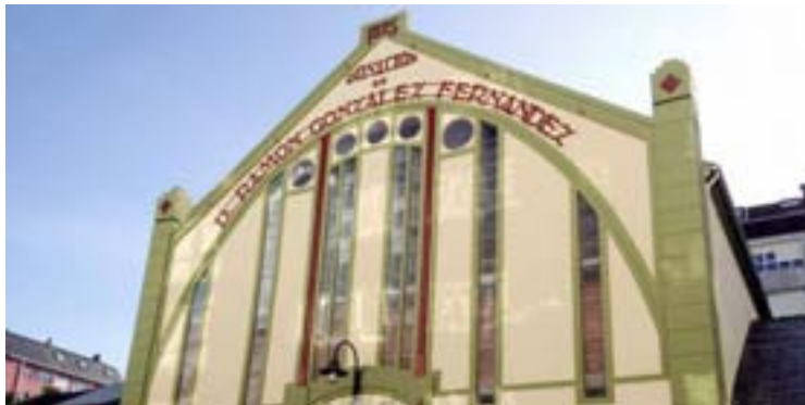
Vista actual da praza de Abastos de Ribadeo

A rehabilitación e reforma interior da praza de abastos de Ribadeo da comezo cun investimento da Xunta de Galicia de 40.000 euros. Trátase dunha achega da Axencia Galega de Desenvolvemento Rural (Agader) que ten como obxectivo a mellora dos mercados de proximidade e as súas infraestruturas. A intervención permitirá mellorar a comodidade, accesibilidade e seguridade dos praxeiros e usuarios da praza de abastos; así coma a eficiencia enerxética. As actuacións previstas inclúen a mellora do pavimento, a adecuación da iluminación interior, a mellora dos aseos,