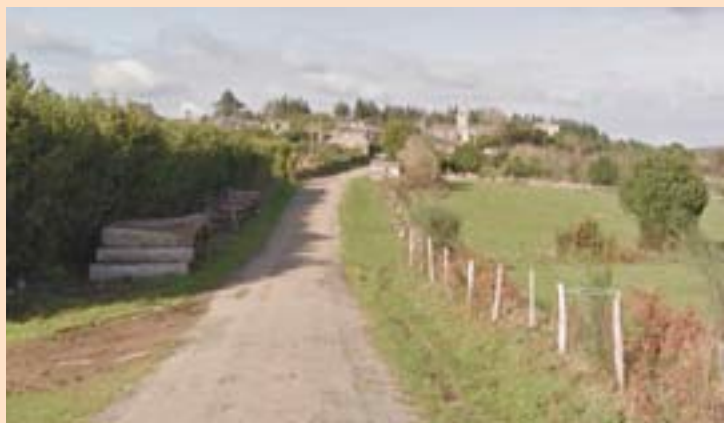
A vía de San Pantaleón a Oourol