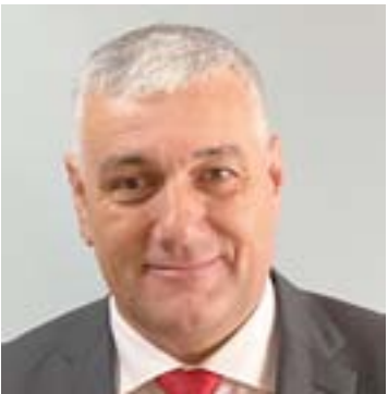
O concelleiro popular saínte e entrante, respectivamente

de Barreiros xestiona este material mediante un sistema de préstamo, evitando así que as familias teñan que afrontar gastos sobrevidos. Outra parte dos fondos destinarase á renovación do material ofimático para favorecer unha prestación máis áxil dos trámites demandados coas distintas administracións (tramitación de expedientes e solicitudes) que a día de hoxe se teñen que facer a través de medios electrónicos. O SAF de Barreiros presta atención a día de hoxe a 67 persoas, non existindo listaxe de agarda, e nel traballan 22 auxiliares.