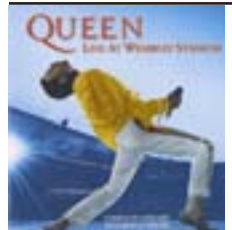
Live at Wembley '86 de Queen