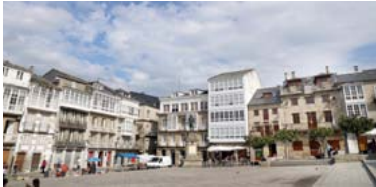
Imaxe do centro de Viveiro

A ordenanza que ten como obxectivo regular o tráfico dentro do casco antigo de Viveiro entrou en vigor o pasado 25 de xaneiro, tendo en conta que se considera peonil na súa totalidade e que actualmente está protexido polo Plan Especial de Protección Interior (PEPRI), ao tempo que se regulan os accesos necesarios para residentes, usuarios de garaxes, titulares de establecementos comerciais, repartidores, obras e demais supostos recollidos na mesma. Esta normativa faise coa pretensión de mellorar e dotar de maior seguridade a todas aquelas persoas que transitan polo interior do casco antigo, en cuxo interior residen moitos veciños e veciñas e están ubicados numerosos establecementos comerciais. O concello quere que se rehabiliten máis vivendas e iso implica