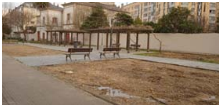
Estado actual do parque dos Indianos

A vicevoceira popular lembra que “este parque foi renovado cun investimento de 220.000 euros na etapa do bipartito cando o señor Suárez era tenente de alcalde” e agora vólvese actuar nel debido “á falta de actuacións de conservación coas que manter en boas condicións este e outros espazos municipais”. Insiste a vicevoceira do Grupo Municipal Popular en que “non hai unha planificación seria de cara á limpeza e con-