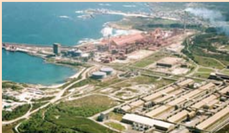
Unha imaxe da factoría de Alcoa en San Cibrao

Para evitar o que pasou coa venda frustrada a Liberty House esixían tamén o compromiso de "ser flexible