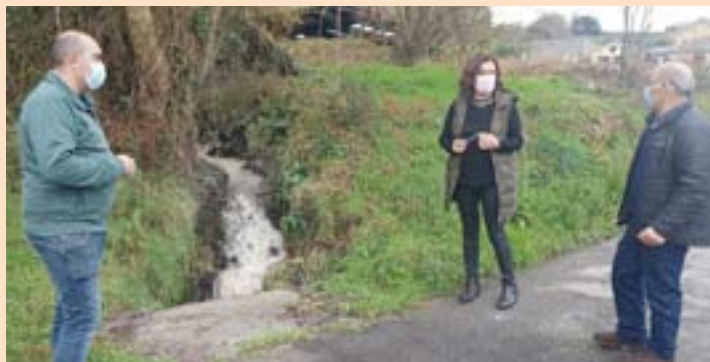
Responsables municipais visitando a zona do verquido

O Concello de Cervo segue moi de preto a evolución do tinguido das augas da praia da Limosa, en San Ciprián, e do leito do Río Xunco, en Cervo; provocado a raíz dos episodios de chuvía intensa que se viviron días pasados; e que derivaron na acumulación de material inerte en ámbolos dous escenarios.