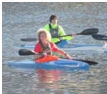
Piragüistas do San Cibrao

As actividades desenvólvense ao longo do ano coa implicación dos sete clubs da provincia, Club Fluvial de Lugo, Club Piragüismo Cidade de Lugo, Club Kayak de Foz, Club Piragüismo de Viveiro, Club Deportivo San Ciprián, Club Piragüismo Altrúan (Ribadeo) e Club de Montaña Quixós (Monforte),