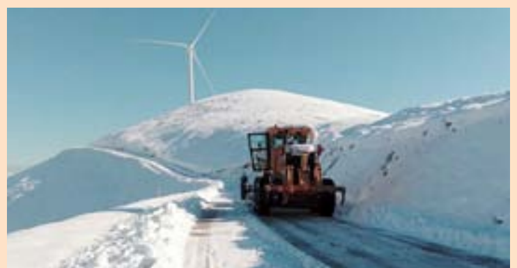
Unha máquina traballando na zona de La Espina

O parque, décimo que promove no Principado, estaría integrado por catro aeroxeradores capaces de fornecer 54.600 megawatts hora (MWh) de enerxía ao ano, equivalentes ao consumo de máis de 21.000 fogares asturianos. Segundo informa a compañía, coa súa posta en marcha evitarase a emisión anual á atmosfera de máis de 21.800 toneladas de CO 2 , e durante a súa construción, propiciarase a creación duns 115 empregos. Ademais, inclúense