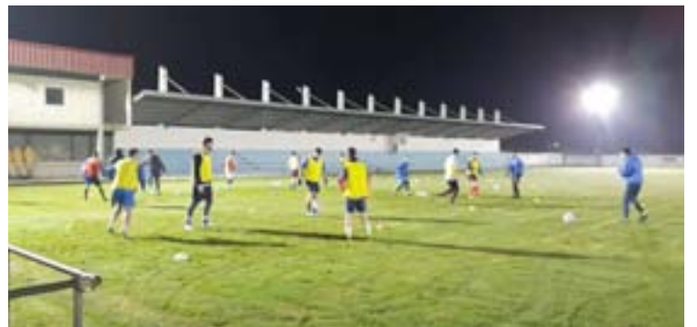
O Ribadeo FC comezou os adestramentos