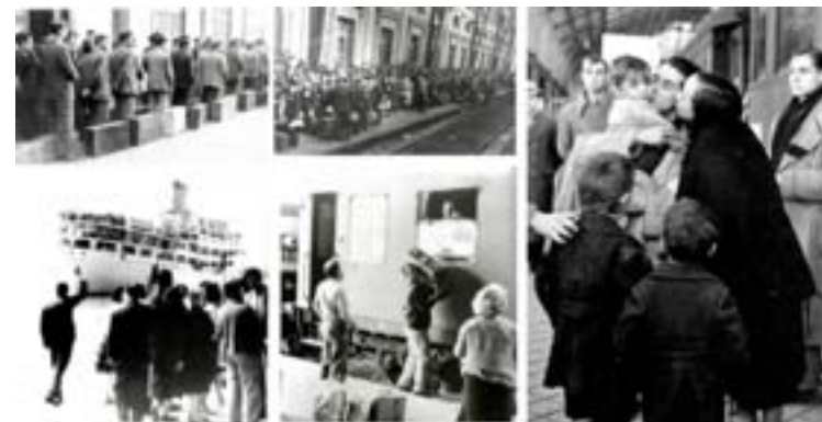
Algunhas das imaxes da exposición

Está aberto o prazo ata o 15 de marzo de 2021 para solicitar o cobro da subvención correspondente ao ano 2020.