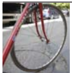
Saír en bicicleta