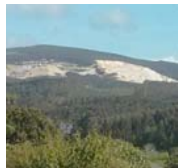
Unha vista da mina

O acordo coa empresa mineira implica o pago de tres cánones anuais que se irán incrementando a medida que a mina amplíe a súa produción. Tamén está prevista a construción dunha planta de produción nos terreos de San Román que podería entrar en funcionamento nun prazo de tres anos. Os comuneiros, no acordo, recollen que serán os primeiros en acceder aos postos de traballo que se creen para esta construción. Así mesmo, está previsto que a em-