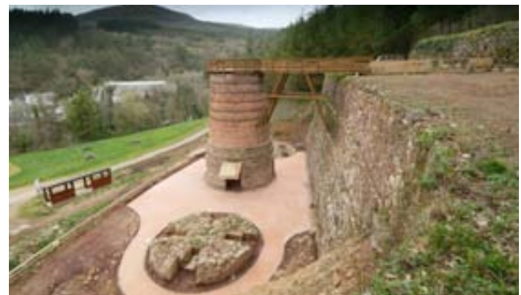
Unha vista do Forno de Bouloso

O grupo de Goberno traballa estes días en preparar os proxectos para os traballos que se acometerán coa partida do Plan Único correspondente a este ano. Así, está previsto nun primeiro momento destinar unha das partidas á reparación de estradas en Vilar de Conforto, Bouloso e Vilameá.