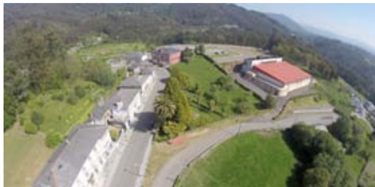
Unha vista aérea de Oourol, donde se ven os edificios que se mellorarán

Trátase dunha reforma que levará a cabo conxuntamente coa rehabilitación enerxética da envolvente térmica dos edificios afectados (a excepción do edificio multiusos que non precisa da devandita rehabilitación). Este segundo proxecto, intimamente relacionado co outro, consiste na