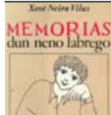
Memorias dun neno labrego de Xosé Neira Vilas