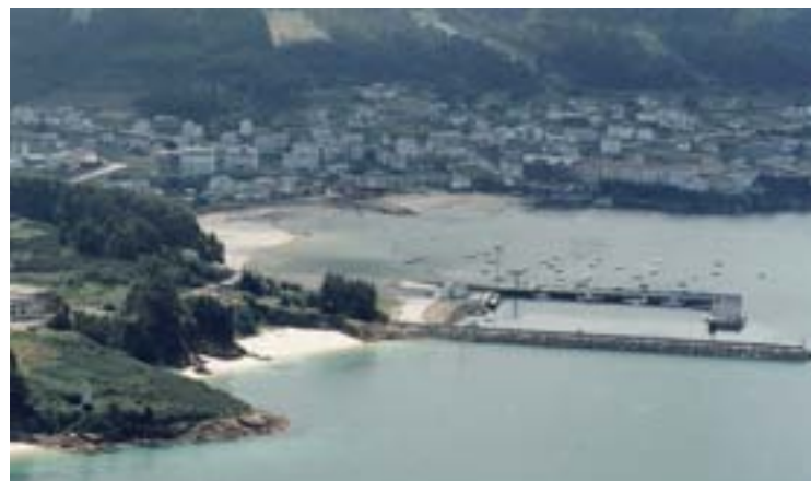
Unha vista xeral do Concello do Vicedo