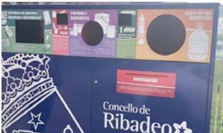
O novo punto limpo está na avenida Rafael Fernández Cardoso

cursiños acreditados na fase de concurso. Isto foi debido a que se computou erroneamente un curso de albanelería, cando esa puntuación correspondería se fose de xardinería, co que se deduciron 0’75 puntos, e entón o aspirante que era o segundo da lista, e que xa estaba chamado para asinar contrato, pasou a ocupar o cuarto posto. De aí que, ao haber dúas prazas temporais, quedou excluído”. Suárez Barcia dixo: “todo isto se manifesta con detalle nunha acta de 14 de xaneiro, que formula precisamente o tribunal de selección, para este proceso de contratación de persoal laboral. Esta acta está exposta ao público e dispoñible na sede electrónica da web municipal”.