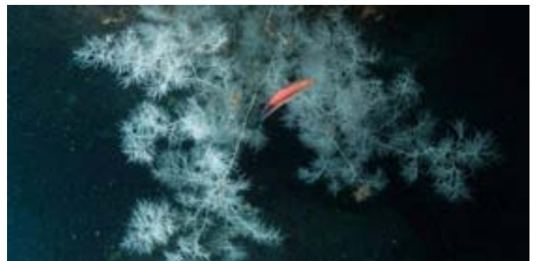
Arriba, os mergulladores e, abaixo, os corais negros atopados

limites do buzo recreativo, calquera mergullador ou mergulladora de certo nivel pode ir a velos. Para nós como investigadores fainos moito mais sinxelo o seu estudo. Se fora máis profundo teríamos que utilizar somerxibles e drones para coller mostas. Así, tirándonos á auga cun tanque, sempre con certa planificación porque segue sendo unha inmersión complicada, podemos facelo.