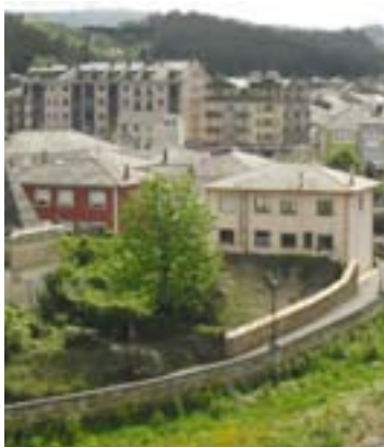
Vista de Vegadeo

A iluminación pública rural do concello de Vegadeo está formado principalmente por luminarias de tipo viario rural equipadas con lámpadas de vapor de sodio de baixa presión de 55 W. Existen tamén algunhas luminarias de tipo cazoleta con lámpadas de vapor de sodio de alta presión de 70 W. As luminarias de tipo viario