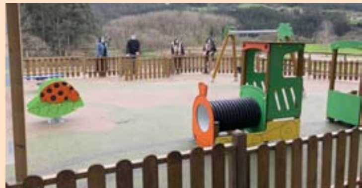
Supervisión das obras realizadas no parque