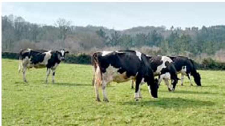
O prazo estará aberto ata o 30 de abril

O DOG publicou a orde da Consellería do Medio Rural que regula a aplicación dos pagamentos directos á agricultura e á gandería e das axudas ao desenvolvemento rural suxeitas ao Sistema Integrado de Xestión e Control, as coñecidas como axudas da PAC. Os gandeiros e agricultores galegos poderán presentar a solicitude única ata o 30 de abril, accedendo directamente cun certificado dixital á aplicación informática SGA ou acudindo ás distintas entidades colaboradoras.