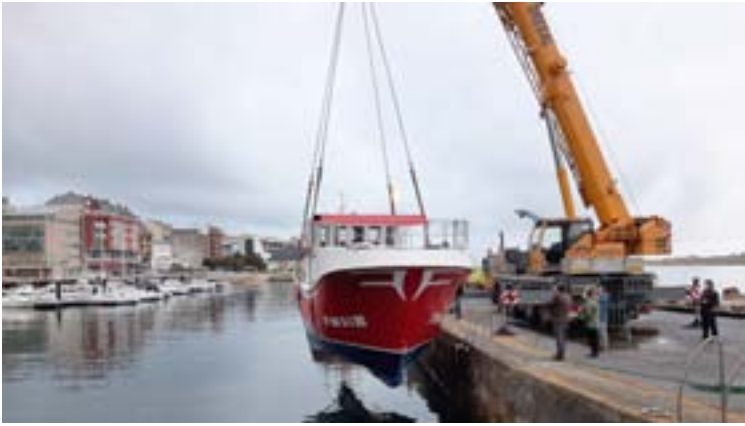
Botadura do barco no porto de Foz

O peirao de Foz acolleu a botadura dun barco pesqueiro construído no polígono industrial de Fazouro.