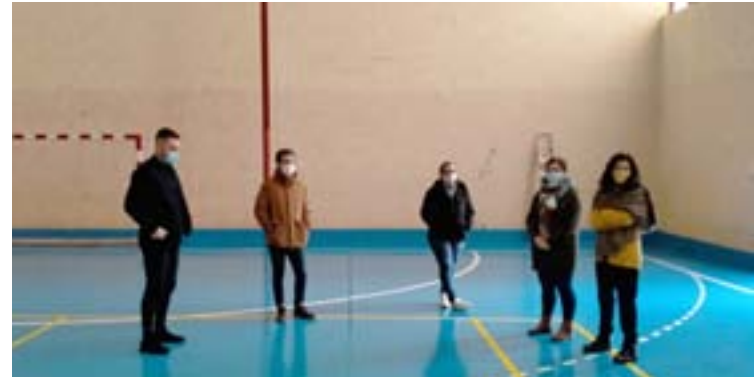
Supervisión dos traballos realizados no pavillón

O Ceip de Cervo conta cun pavillón renovado logo dun investimento de 28.000 euros, dos cales 15.000 foron aportados pola Xunta de Galicia, a través da Consellería de Educación, e a cantidade restante polo Concello de Cervo. Os traballos consistiron na rexeneración do pavimento, selado de gretas e a aplicación dun acabado satinado, así como na marcade das liñas de fútbol sala, voleibol, tenis, baloncesto e balomán na pista polideportiva. Esta nova actuación vén sumarse á recente renovación integral acometida no centro pola Administra-