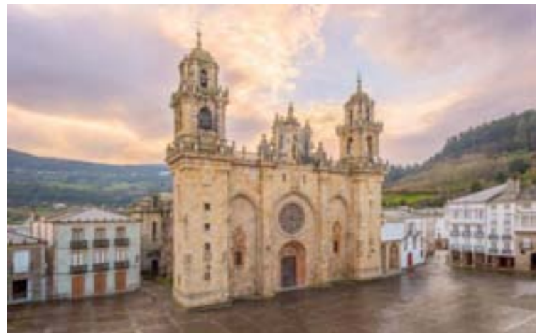
Unha vista da praza da Catedral de Mondoñedo

Tras recibir nas plataformas e lugares habilitados a tal fin ata esta data máis de 800 sinaturas de apoio procedentes de Mondoñedo e doutros moitos lugares, e receptionar numerosas opinións, incluí-