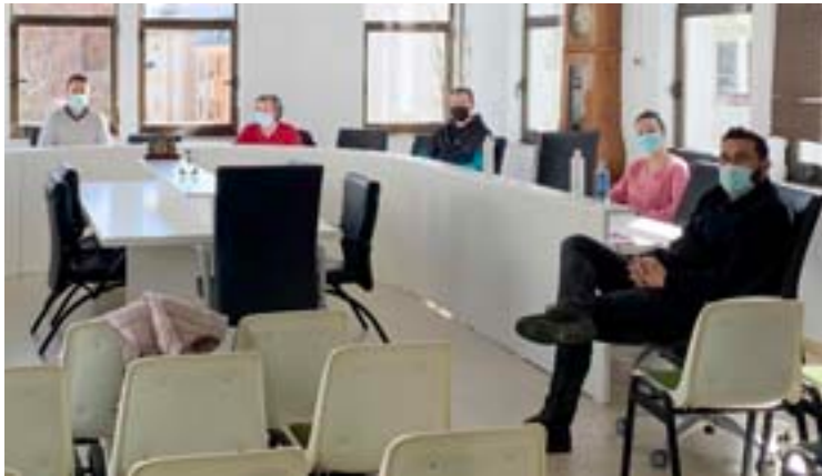
Reunión do alcalde cos hostaleiros do municipio

O Concello tamén se encargará de incrementar o apoio económico do Concello á Asociación de Comerciantes, Industriais e Autónomos de Foz. “Considerando á ACIA como o ente máis próximo a todos os hostaleiros,