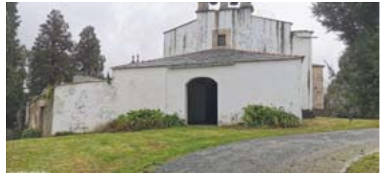
Unha imaxe de como quedaron os traballos de desbroce

O Concello de Lourenzá está a realizar estes días diferentes traballos de limpeza de contas e adecuación de espazos verdes con persoal municipal. Ademais, continúase cos traballos de desbroce que se están acometendo nas áreas verdes. Así, traballouse en Fonte de Pousada, Fonte da Clara, Ponte de Pumarega, contorna da Capela da O e contorna da igrexa e cemiterio de San Xurxo.