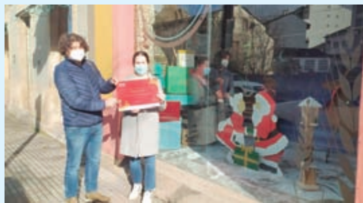
Entrega do premio do concurso de escaparates

Tralos votos do público, a Panadería Pallares de Sarria foi o establecemento gañador do concurso de escaparates convocado pola Asociación de Comerciantes e Empresarios de Sarria.