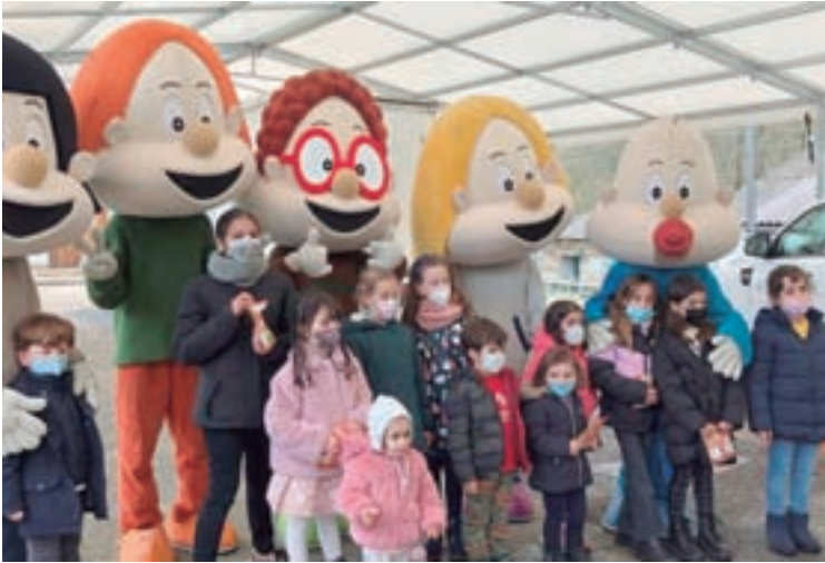
Os Bolechas visitaron Triacastela