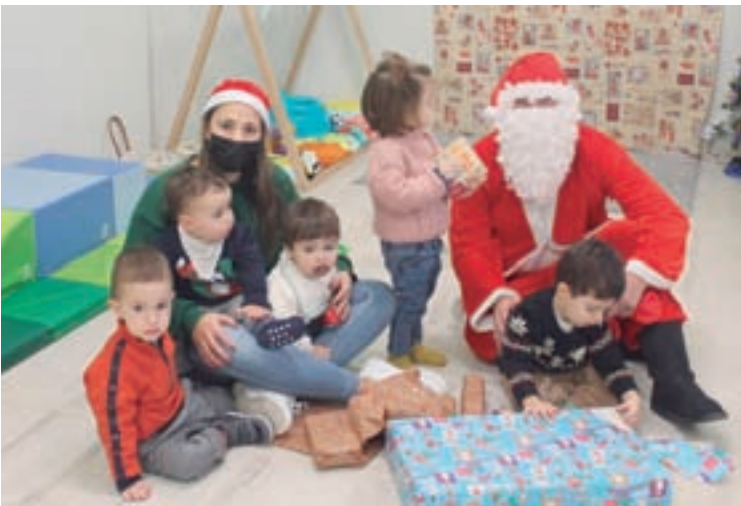
Papá Noel agasallou aos cativos da Casa Niño Pitiños de Paradelá