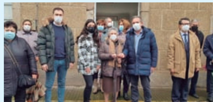
Acto de entrega das chaves da estación

O Concello recibiu as chaves dos terreos da Antiga Estación do Tren de Pobra de San Xiao. Estes terreos foron expropiados a Adif por 111.600 euros. O acto de entrega tivo lugar no vello edificio coa sinatura da acta de ocupación e pago da compra.