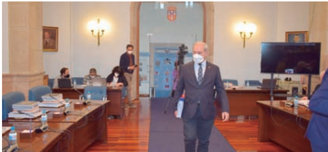
O presidente da Deputación, entrando no salón de plenos