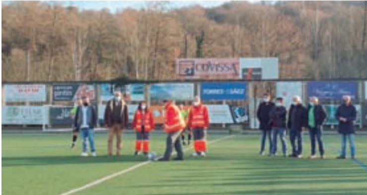
Saque inaugural do derbi

O responsable destacou “a calorosa benvida que as nenas e nenos do CB Sarria deron ao CB Breogán” e agradeceu a implicación do club breoganista nestas iniciativas que “xeneran ilusión entre os rapaces e rapazas e contribúen a afianzar o seu interese polo deporte”.