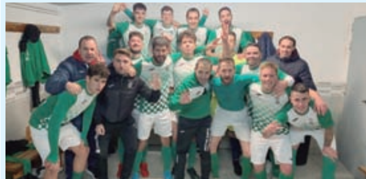
O Paradela na súa celebración

A competición de Segunda Galicia aínda ten partidos por xogar debido ao seu aprazamento tras detectar xogadores positivos entre os cadros de deportistas.