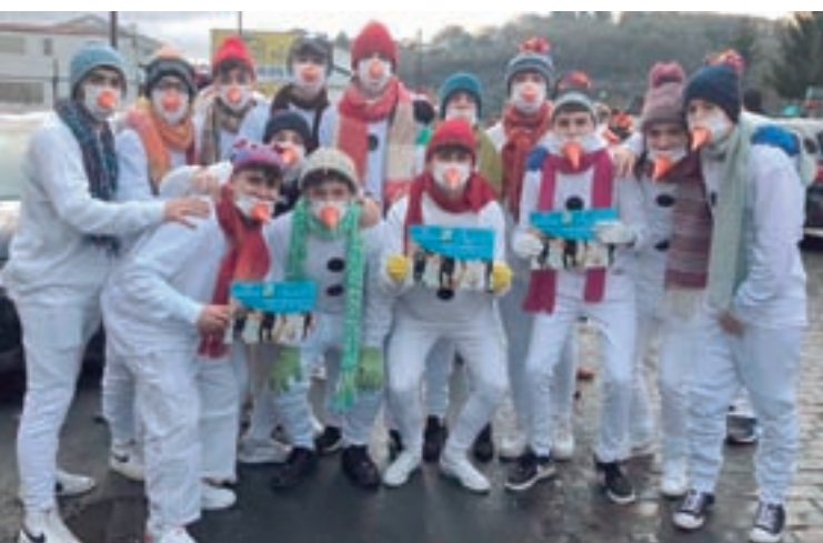
Diferentes momentos da Sarriana no desfile de Nadal que tivo lugar polas rúas de Sarria coa participación de pequenos e maiores