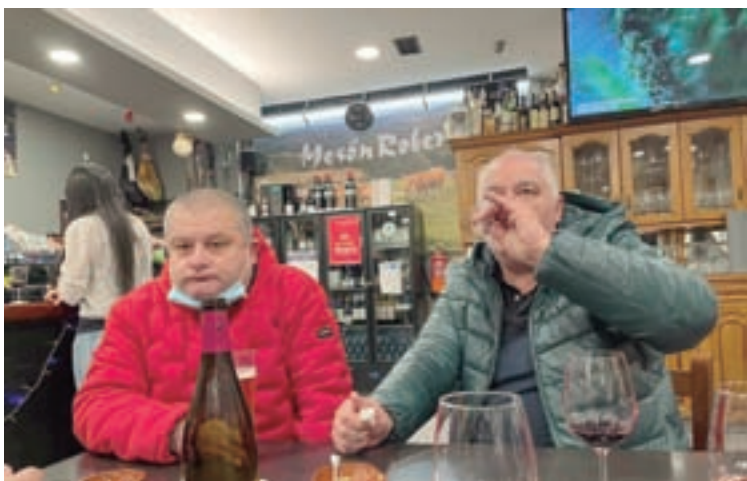
Participantes no Tapicheo 2021

O resultado popular do Tapicheo 2021 de Sarria deixa no número un ao Don Pepe con Nueva Normalidad .