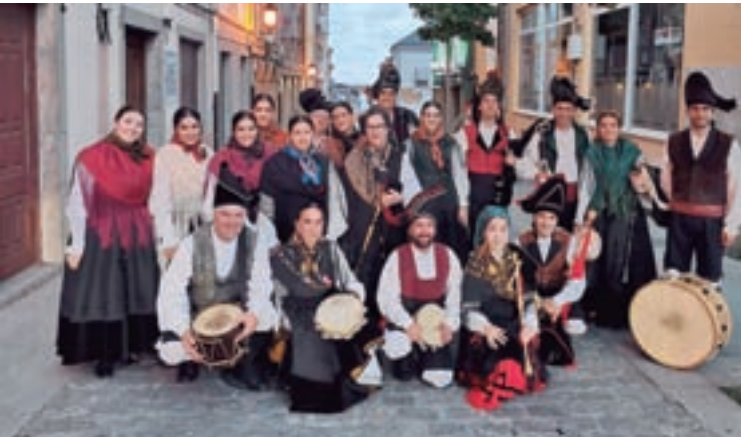
Arriba, a banda de música de Sarria e abaixo, Peleríños

No relativo ás campañas habituais que coinciden con datas sinaladas no calendario (San Valentín, día da nai, día do pai, ...) imos variando a dinámica da mesma, na procura de captar a atención dos nosos clientes en cada momento. Antes da pandemia celebrabamos a "Sarria Fashion Night" na cal as rúas da vila se vestían de moda.