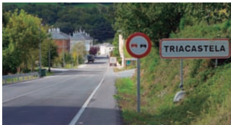
Entrada a Triacastela

O plan recolle unha superficie total de 14.033 metros cadrados, destes, 8.104 serán de uso industrial, 2.324 metros serán destinados a zonas verdes, 650 metros para infraestruturas de servizos e 2.954 para comunicacións. Estará situado xunta á intersección da estrada LU-633 e a vía de acceso a Vilavella. Unha vez se aprobe o plan e se realice a obra, prevese que o ac-