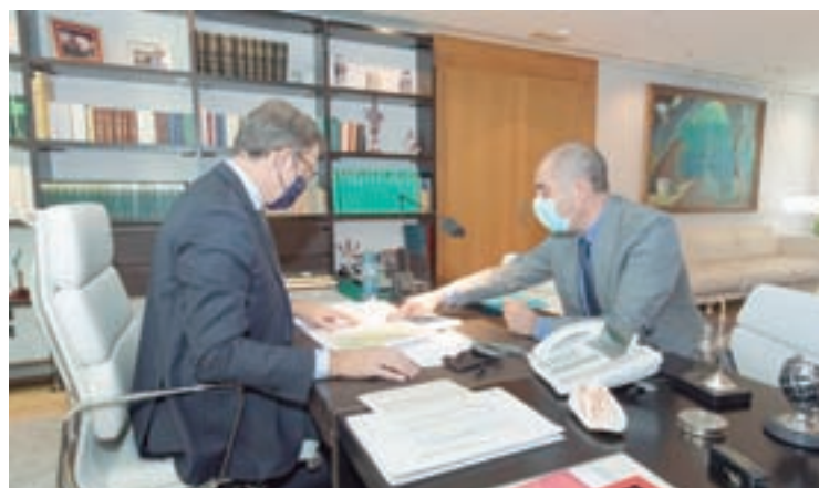
Reunión do alcalde co presidente da Xunta

O presidente da Xunta, Alberto Núñez Feijóo, analizou co alcalde do Incio, Héctor Manuel Corujo, o proxecto do arquitecto Manuel Gallejo Jorredo para o Plan Hurbe do Concello.