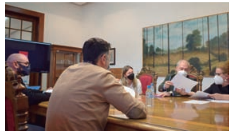
Reunión da comisión de Igualdade

Tras esta xuntanza, constituíuse a comisión encargada de impulsar e