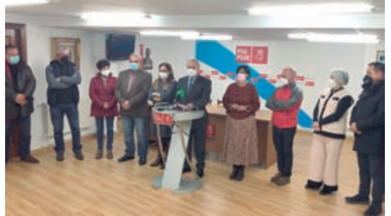
Presentación do equipo de Tomé

Para elo propón “unha estrutura orgánica, un modelo de funcionamento e un proxecto político que consolide e que mellore os resultados do Partido Socialista que hoxe temos na provincia de Lugo, de cara ás próximas eleccións municipais”, e que “toda esta forza municipalista sirva de palanca de impulso para contribuir e ser determinantes para lograr o cambio na Xunta de Galicia