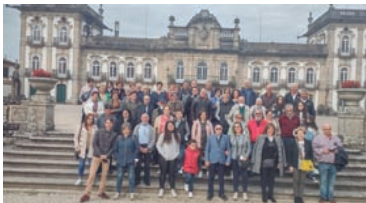
De arriba a abaixo, o CB Sarria e a Asociación Mulleres Rurais de Paradela