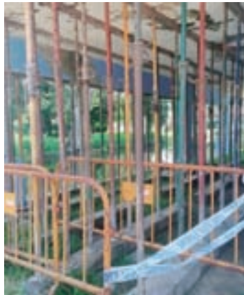
A zona do Chanto

Así pois, dende o PP sinalan o "estado de abandono no seu 60 aniversario. Co edificio público apuntalado dende fai un ano, co río Sarria, na tradicional zona de baño, sucio e descoidado e coa