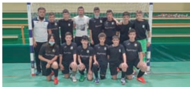
Os diferentes equipos que forman parte do club Os Meigallos