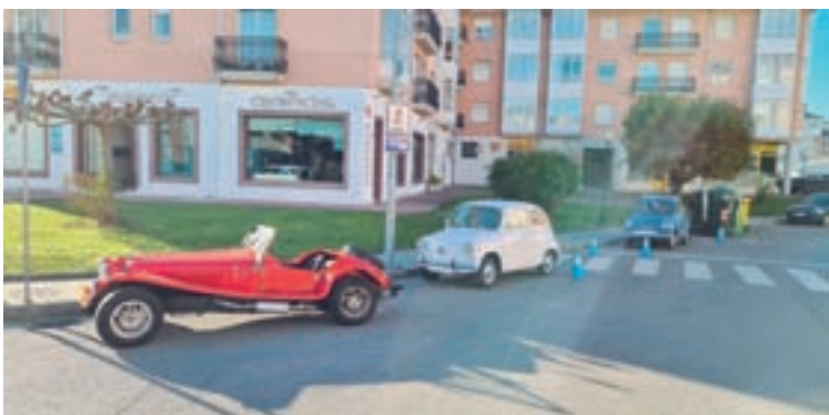
Algúns dos vehículos que forman parte da asociación