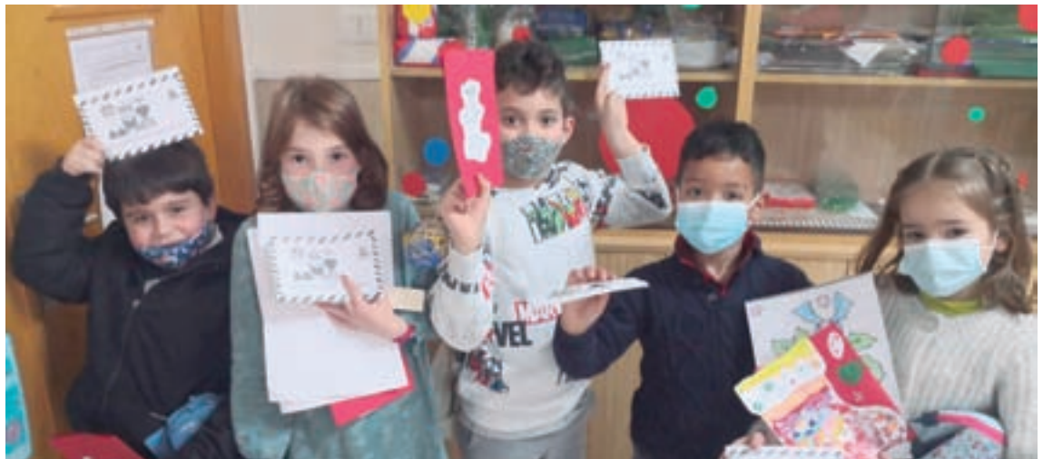
O anpa do Incio realizou actividades extraescolares