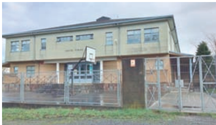
O CEIP Plurilingüe do Páramo

Estas xornadas están promovidas en colaboración cos Grupos de Desenvolvemento Rural (GDR) e perseguen un dobre obxectivo; por unha banda, apoiar aos pequenos e medianos produtores galegos, e por outra, promover unha alimentación infantil saudable. Os propios centros elixiron os produtos alimentarios de entre a oferta de Mercaproximidade, a canle alternativa de comercialización habilitada pola Xunta ao inicio da emerxencia sanitaria para garantir que as producións do sector primario galego atopaban