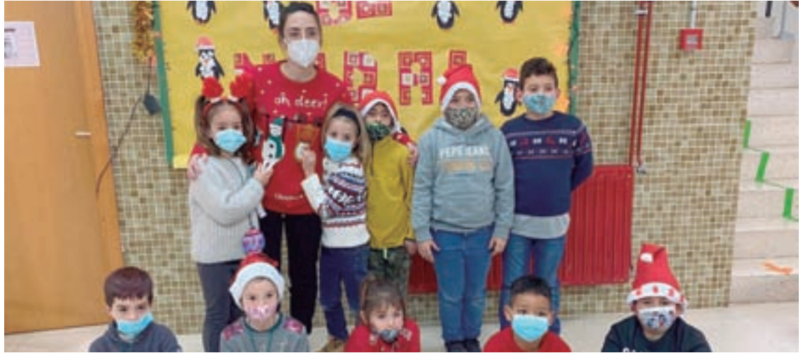
Os pequenos do Ceip Ricardo Gasset do Incio estiveron de celebración de Nadal