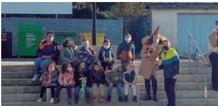
Os pequenos, durante o acto das badaladas

Os nenos do CEIP Ricardo Gasset do Incio celebraron unha iniciativa chea de maxia, orixinalidade e tradición.