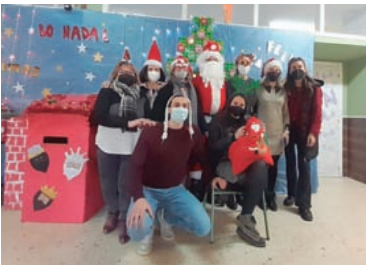
O Ceip Plurilingue San Miguel de Paradelá tamén desfrutou desta época festiva con distintas celebracións no centro, que contou coa visita de Papá Noel