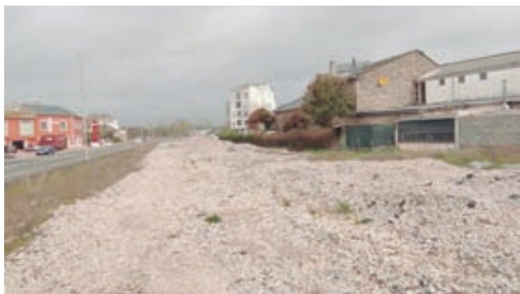
Os terreos do tren, que se incorporan á vila

A veces fago un balance mental e estou satisfeito, parece imposible que se fixera todo o que se fixo no Concello. Teño que agradecerlle nese sentido aos concelleiros da corporación o traballo feito xa que sempre confiaron moito en min e me brindaron moito apoio. Por iso, lles teño moito que agradecer xa que é un factor moi importante. Penso que é fundamental que o alcalde poida contar cuns compañeiros que o apoien e que saiba que pode tomar decisións sen ter marxe de tempo para preguntar e sentirse respaldado na elección.