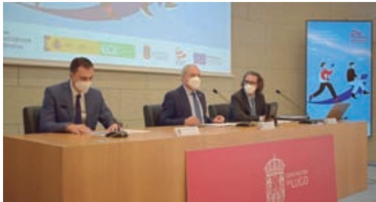
Presentación do programa Reiníciate

A formación estará dirixida, principalmente, á adquisición de coñecementos e tarefas vencelladas ás novas tecnoloxías, á dixitalización e á administración electrónica. Os con-