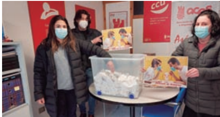
Asociación de Comerciantes, Empresarios, Profesionais e Autónomos de Sarria

A cultura, foi un dos sectores máis paralizados e un dos que máis di-