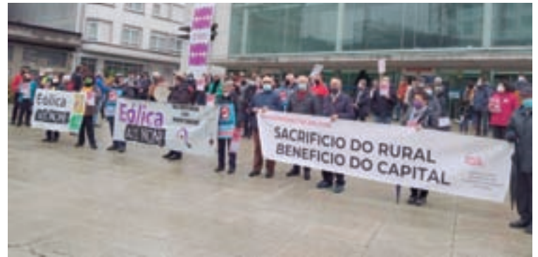
Concentración en Lugo contra os eólicos

Como xa acontecera o pasado 5 de xuño na Praza do Obardeiro de Santiago de Compostela, a resposta da sociedade galega foi contundente. A multitude congregada desta volta en diferentes localidades do país volveu reclamar á Xunta a paralización urxente, real e efectiva dos case 300 parques eólicos que se atopan actualmente en tramitación e que se prevén instalar. Máis de 170 entidades que fan parte da coordinadora, entre colectivos e plataformas veciñais, de afectados/as, ecoloxistas, culturais, sociais ou políticas, rexeitan a “falaz e inútil moratoria anunciada polo goberno de Feijóo, por