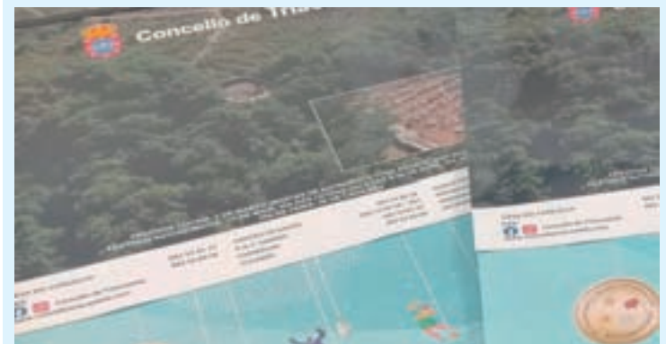
Os calendarios de Triacastela

Durante os vindeiros días o Concello de Triacastela repartirá aos veciños os novos calendarios do ano 2022.