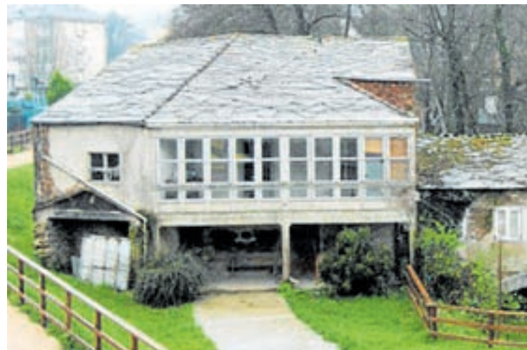
O Muíño do Toleiro no seu estado actual

Así pois, o Malecón é o encargado, ademais, de albergar nada máis e nada menos que unha construción que data de finais do século XII, o muíño do Toleiro. Esta infraestrutura fun-