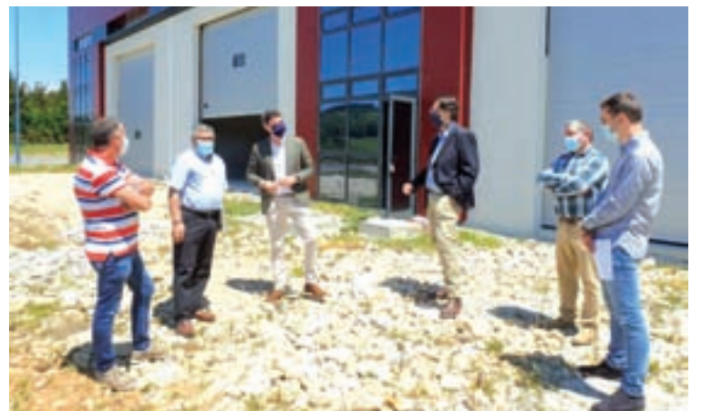
Unha imaxe de arquivo da visita de Arias ao viveiro de Paradelade

Unha vez saia o concurso, os interesados terán un mes para presentar as solicitudes. As instalacións estarán destinadas a aquelas empresas que aínda non estean constituídas e o fagan nun máximo de tres meses desde que se resolva o acollemento, e a aquelas empresas que teñan como máximo seis meses de idade dende a súa constitución ata a data da solicitude. É fundamental que o proxecto que presente cada empresa garanta estabilidade no emprego e na actividade que vai desenvolver, sendo esta acorde e afín as características físicas do viveiro.