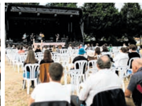
Imaxes de David Tombilla de edicións anteriores do festival e o cartel deste ano