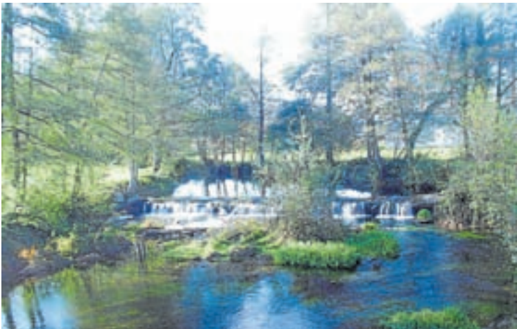
Unha imaxe do río Sarria

O servizo de atención temperá de Sarria está formado por un mestre psicomotricista, unha psicóloga, unha logopeda e unha pedagoga, especializados en nenos e nenas con idades comprendidas entre os 0 e os 6 anos, nos que exista unha sospeita dalgún trastorno do desenvolvemento, ou risco de padecelo e, tamén as súas familias.