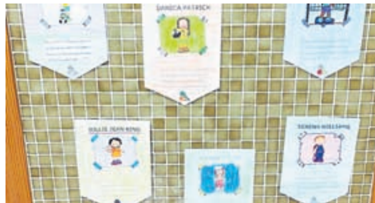
Os traballos realizados no colexio

Ademais, resaltouse a través dunha mostra, mulleres destacadas en