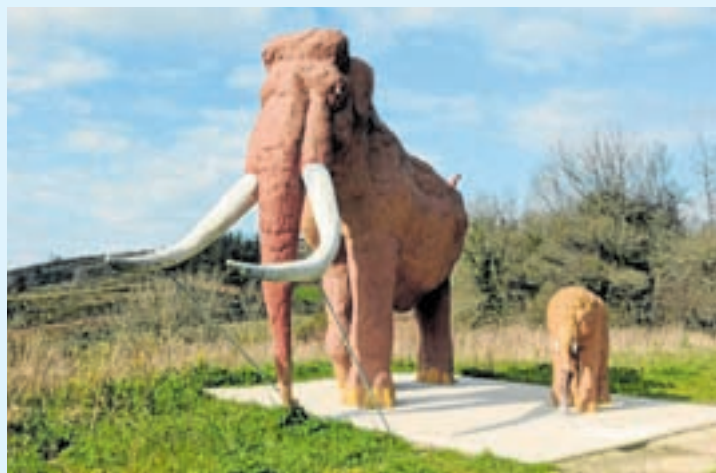
Réplicas xigantes de mamuts

A iluminación das réplicas xigantes dos mamuts do Incio son un gran reclamo turístico, por iso, o PSOE do Incio propón ao Concello a solicitude da axuda a Xencia de Turismo de Galicia co fin de iluminar estas dúas figuras e darlle máis valor.