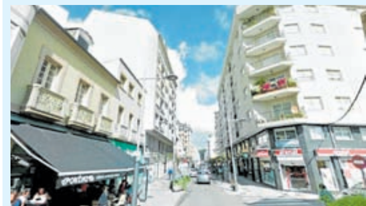
O edificio da polémica

Este novo proxecto conta co permiso de Patrimonio, necesario ao estar este edificio no casco histórico e no Camiño Francés.