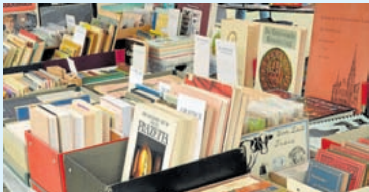
Imaxe dun dos postos habituais da feira

Volve a Feira de San Lázaro de Antigüidades e Restauración a Sarria. Despois de dous anos de parón, a celebración será os días 7 e 8 de maio e manterá a súa localización na Rúa Porvir.