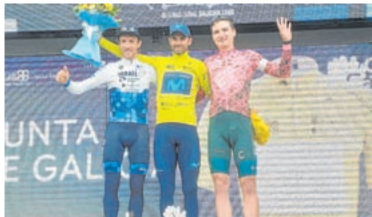
Alejandro Valverde no podio

A este respecto, sinalou que “a vitoria de Alejandro Valverde na clasificación xeral dálle aínda máis visibilidade a unha proba coa que demostramos que aquí podemos organizar e acoller grandes eventos deportivos internacionais” e felicítouse “pola participación na proba de ciclistas galegos profesionais que non