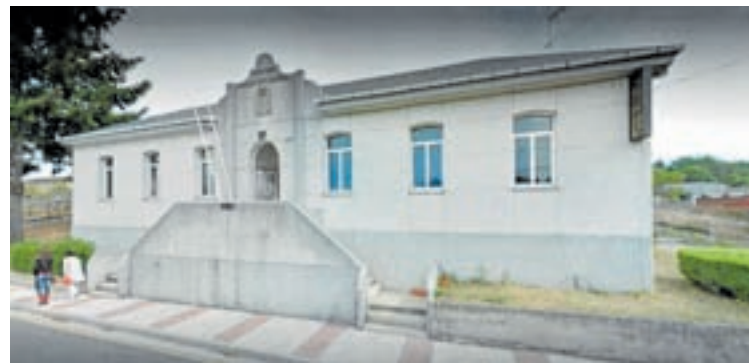
Biblioteca da Pobra de San Xiao

O convenio foi firmado fai uns meses, este aula mentor, que está localizada na biblioteca da Pobra de San Xiao é a primeira destas características da Comarca de Sarria. Nas instalacións, o alumnado realizará a matrícula aos cursos e os exames