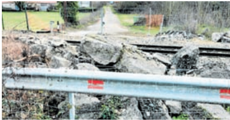
O paso do tren no Mazadoiro

Por este motivo, dende o Grupo Popular instan ao goberno municipal a que se poña en contacto con Adif para darlle solución