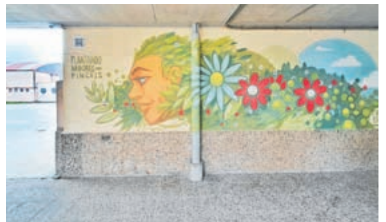
Arriba, os rapaces, nos labores de campo e, abaixo, o novo mural

fotocatalíticas anticontaminación, que absorben o CO2 do ambiente, trátase de pinturas que non só non contaminan, senón que ademais absorben e depuran os contaminantes que hai no aire, coma os óxidos de nitróxeno e outros gases contaminantes da industria e o tráfico rodado (cada metro cadrado desta pintura equivale ao efecto depurativo que achega ao medio ambiente unha árbore adulta). De aí o nome da actividade "Plantando árbores con pinceis".