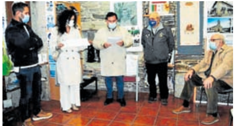
Presentación da iniciativa

Foi na sede desta asociación en Sarria onde se fixo a presentación desta nova credencial. Este novo documento trata de recoñecer o esforzo destes animais que son os que cargan ao xinete ou as súas pertenzas. Tan só no ano 2019 foron máis de 400 peregrinos os que decidiron realizar o camiño a costas dun cabalo. O custe desta credencial será de 5 euros, dous serán para o albergue ou asociación que a vende, 1,50 euros irán destinados aos gastos que supón a impresión do mesmo e a cantidade restante irá destinada a Equum Peregrinans que serán os encargados de firmar o documento na chegada a Compostela. Esta credencial non só serve para