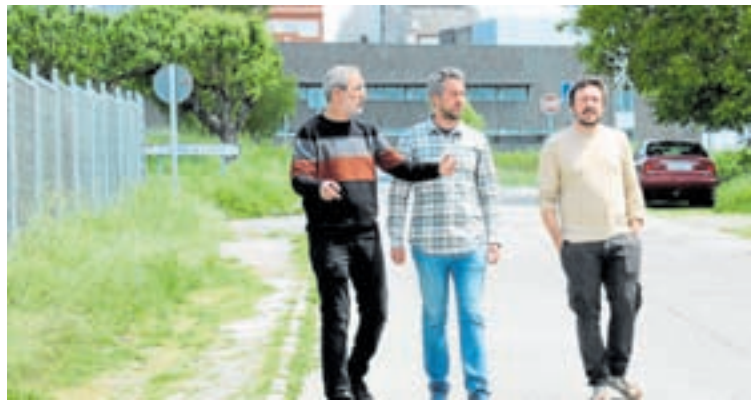
Visita á rúa Bal y Gay

BAL Y GAY. O Concello de Lugo vén de anunciar o inicio, nas vindeiras