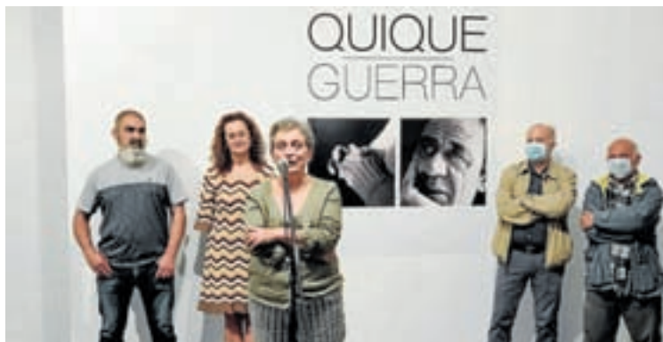
Inauguración da mostra de Quique Guerra no Museo

Unha escolma da obra escultórica e pictórica do artista mariño Quique Guerra, pode verse no Museo de Lugo. A exposición titulada co nome do artista manterase ata o vindeiro 29 de xuño.