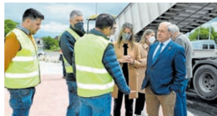
Visita do presidente da Deputación ás obras xunto á alcaldesa

“Hoxe por hoxe vemos moi próximo o fin destas obras, unha gran noticia para o Concello e para a Deputación porque este proxecto beneficia aos veciños e veciñas da cidade, pero tamén de toda a provincia, sobre todo