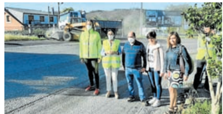
Supervisión das obras da travesía de Guntín

A subdelegada do Goberno destacou a importancia desta actuación para solucionar o problema ocasionado polo mal estado do firme na travesía de Guntín. Asemade, felicítouse pola celeridade coa que se están a executar os traballos “o que permitirá mini-