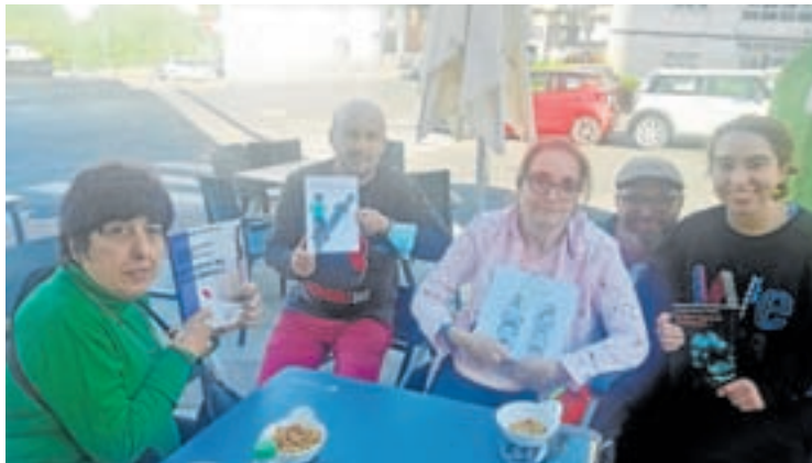
Participantes do colectivo coas súas publicacións

A.R.: Polo momento está pechada, pero en canto volvamos a abrir, queremos que sexa algo aberto a toda a poboación, que calquera poda participar.