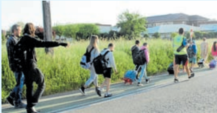
Rapaces de camiño ao colexio

Arroso explicou que “con esta iniciativa buscan crear o hábito de ir a pé ao colexio”, e considerou que as iniciativas de calmado do tráfico que executou a área de Mobilidade “permitiron que este colexio fose un bo escenario para pór a andar este proxecto”. “Comezamos no colexio de Albeiros, a modo de proxecto piloto ata final de curso, e para o vindeiro ano continuaremos a expandir os vieiros a máis centros”, explicou o Tenente Alcalde. Actualmente, as nenas e nenos que acoden ao colexio de Albeiros poden realizar dous percorridos, segundo a zona na que residen. O