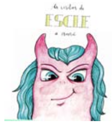
As visitas de Esclerose a mamá, libro publicado en común polos participantes do proxecto EMcreativo

M.V.: Xorde porque eu contei, como lles explicaba aos meus nenos pequenos o que me pasaba a min. A min, dábase un brote, e como lle explico a unha nena de dous anos e a un bebé o que me estaba pasando? Pois tomándoo como un xogo. Se a mamá lle leva a cabeceira para atrás, colocámoslla ben. A miña filla maior ao irmán tíñalle que mirar a temperatura do biberón, eu non tiña tacto. Tiveron que aprender moitas cousas dende