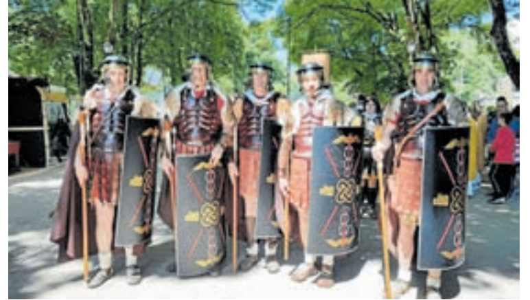
Diferentes momentos do Arde Lucus do ano pasado e, no medio, o cartaz desta edición

Un paseo atrás no tempo, a maxia de darlle a man ás nosas raíces, descubrir outra realidade ou formar parte da historia. Todo iso é Arde Lvcvs. E é que máis aló da festa, o Arde Lvcvs xa é unha forma de ver Lugo dende outra perspectiva: a da historia.