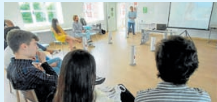
Primeira reunión da mocidade no plan Axenda Urbana

O emprego, a vivenda e o coidado medioambiental son algúns dos temas que máis preocupan á xuventude lucense. Ao redor dunha vintena de mozos e mozas participaron no primeiro encontro de participación cidadá no CEI Nodus, enmarcado no plan de acción Axenda Urbana 2030 do Concello.