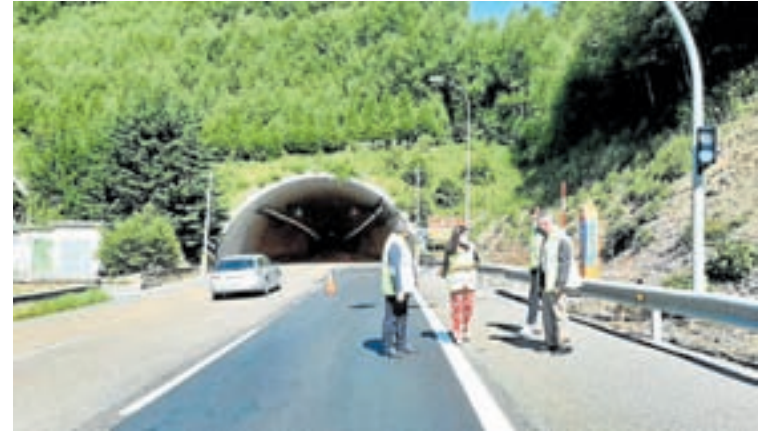
Aberto o desvío do tráfico polos derrubes do viaduto do Castro

Neste contexto, o director xeral de Estradas informou que outra solución en fase de estudo para o tráfico xeral con sentido Madrid é o establecemento do desvío desde a A-6 á N-6 no semienlace Leste de Pedrafita do Cebreiro sito no p.k. 431 da A-6. Así mesmo, esta última proposta permitiría o tránsito de vehículos especiais, en ambos