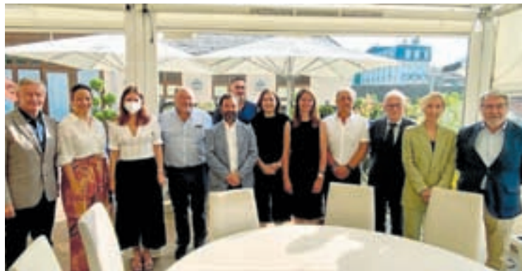
Presentación do proxecto

As empresas presentaron os seus proxectos aos membros do Comité de Investimentos, formado polo Concello de Lugo, que mobiliza nesta estratexia 12 millóns de euros mentres as empresas que apostaron por colaborar coa iniciativa municipal de creación de emprego aportaron un millón de euros máis. A xestora de Lugo Transforma analiza xa as condicións destas catro propostas empresarias co fin de estudar a viabilidade da entrada do fondo municipal no seu accionariado, ademais de darlle apoio e asesoramento no proceso de consolidación.