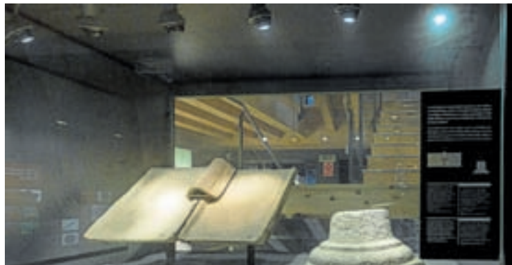
Dúas imaxes do centro de interpretación da muralla e, e á dereita, mosaicos das casas

cidade abre unha nova porta que desvela os secretos da Muralla mostrando desde as súas características constructivas, a súa historia ata os seus múltiples usos. Con unha perspectiva máis social e lúdica o espazo axuda a dialogar co viaxeiro o que lle proporciona unha porta cara o coñecemento do seu pasado.