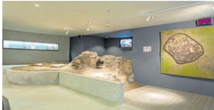
Arriba, o Domus Mitreo e o centro arqueolóxico de San Roque, e á dereita, fragmentos dun morteiro de mármore