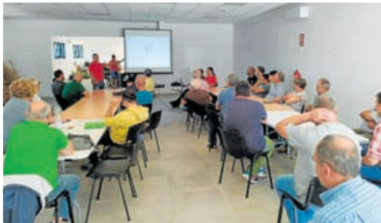
Curso no que participaron os veciños para estudar os soutos

o vindeiro 24 de setembro cunha xornada sobre coidados xerais e poda de froiteiras.