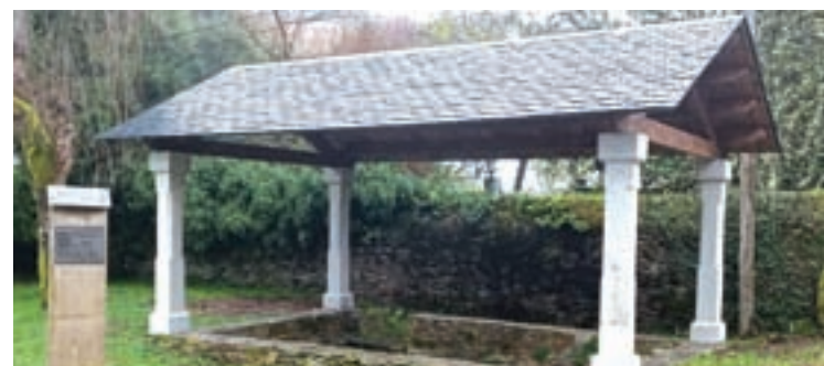
LAVADOIRO. Remataron as obras do lavadoiro de Muras que fora destruído nun accidente. O traballo de recuperación deste ben municipal estivo ao cargo da mesma empresa que remodelou a pontiga de Samil.

Vaise crear unha única zona cun firme de formigón, que estará dotado de novo mobiliario urbano. Este punto estará ordenado, indicando con claridade o viario destinado ao uso dos vehículos así como das zonas destinadas a aparcamento. Esta obra incluírá melloras en accesibilidade pensadas para persoas con mobilidade reducida ou carros de bebés. Así mesmo, renovaranse os servizos públicos como a rede de saneamento, pluviais, a rede de enerxía eléctrica, a rede de telecomunicacións e o alumeadado público. Simbolizarase o Viveiró como o corazón do Xistral mediante o plantado de árbores en torno a uns círculos de céspede.