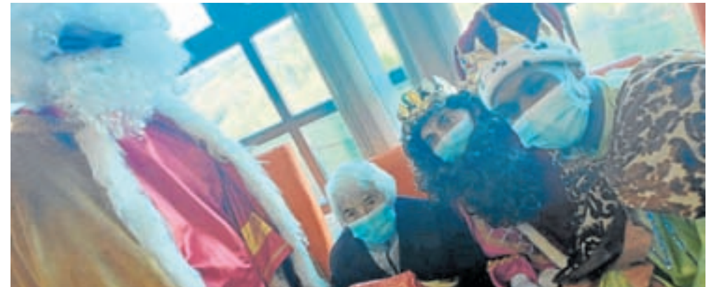
De arriba a abaixo e de esquerda a dereita, imaxes das cabalgatas de Reis do día 5 de xaneiro nas Pontes, Begonte, Friol, Guitiriz, Muras, A Pastoriza, Pol, Rábade, Meira e Abadín