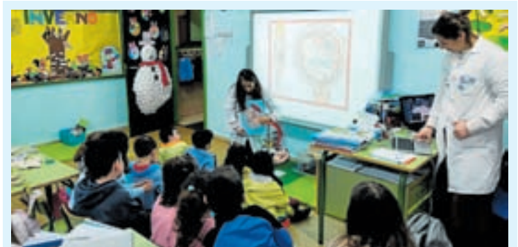
CEIP EDUARDO CELA VILA. Dúas matronas do Colexio de Enfermería de Lugo, visitaron o CEIP Eduardo Cela Vila. Durante a xornada, amosaron aos nenos a importancia de coñecer e respectar o seu propio corpo a través de diferentes explicacións, xogos, lecturas e vídeos.