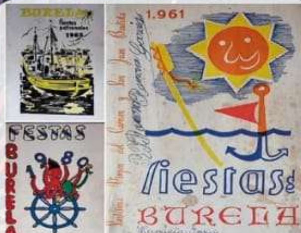
Libriños de festas de Burela dos anos 1961, 1965 e 1980

Hai que agardar ao ano 1940 para atopar nas fontes fiscais datos deste