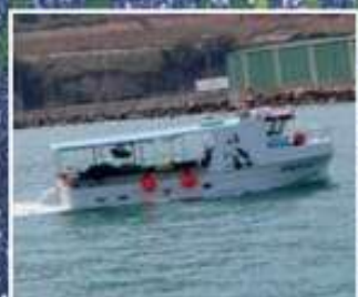
Mar de Annea