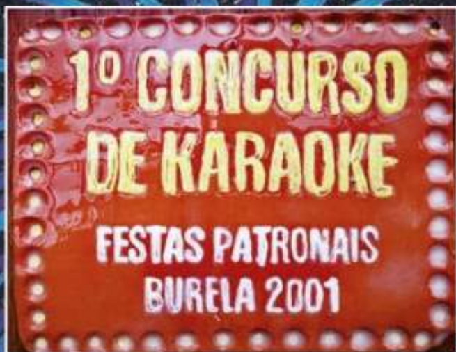
1.º karaoke 2001

As festas, como a vida mesma, foron evolucionando. O campo da festa foi cambiando de localización, desde o que agora é a estación de FEVE ata a actual no porto. Tamén cambiou a procesión marítima, un acto moi vistoso no que moitos participamos algunha vez, nunha especie de “bautismo náutico” para os que non somos mariñeiros, pero que por diferentes problemas agora deixou de ser tan multitudinaria como outrora. A fama da alfombra floral, pola contra, alcanza proxección internacional. É un exemplo de arte efémera que se confecciona desde hai aproximadamente 30 anos, e na que cada día participa máis xente cortando flores e elaborando os magníficos e orixinais deseños.