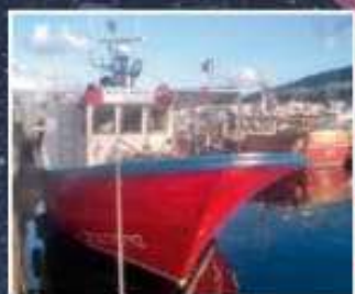
Villa de Argote Dous