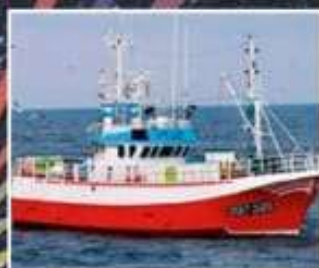
Cruz y Cristo