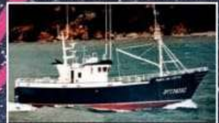
Punta do Castro