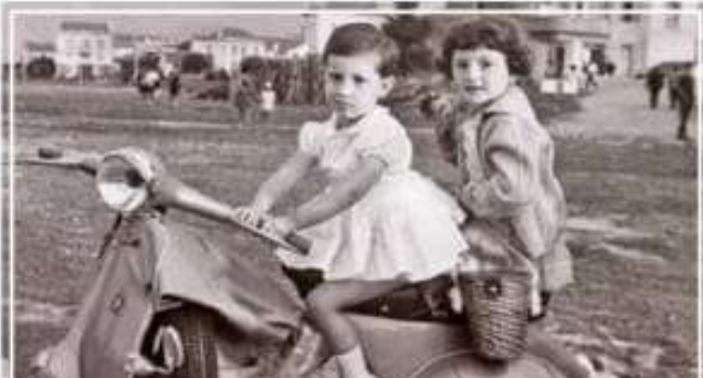
Dúas nenas diante de Calzados Tomás, nas festas de 1960