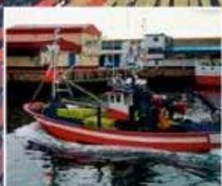
Costa de Lugo