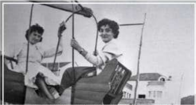
Dúas mulleres montando en atraccións (1960)