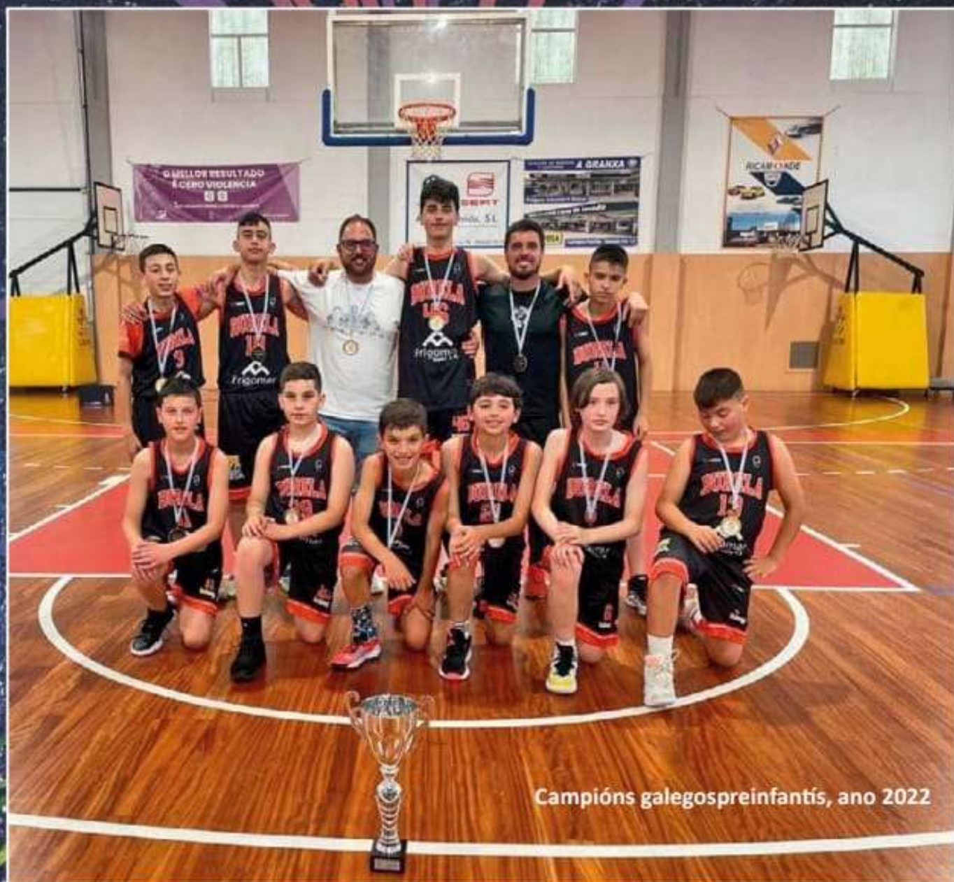
Campións galegos preinfantís, ano 2022