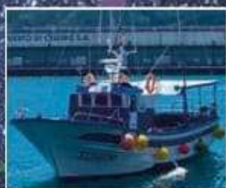
Playa de Lira