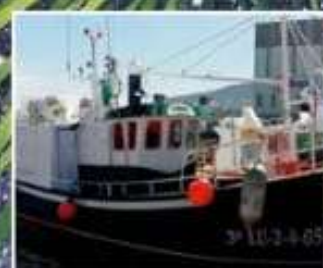
Virxen do Rocío