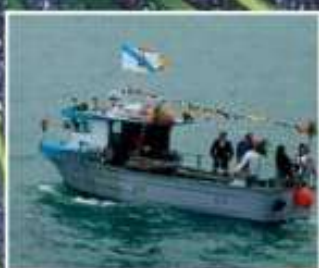
Raíña do Mar