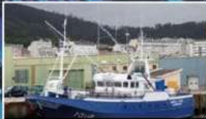
Zamora II Burela