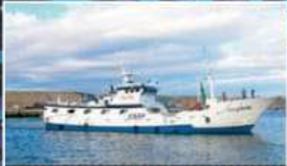
Llave de Burela