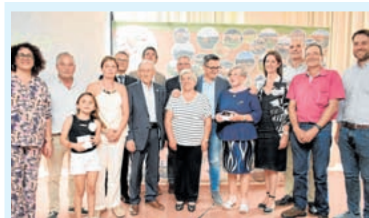
HOMENAXE. Os gandeiros e gandeiras da provincia que cesaron a súa actividade o ano pasado por xubilación foron homenaxeados nun acto organizado pola Asociación Nacional de Criadores de Gando Vacún Selecto de Rubia Galega, Acrua.