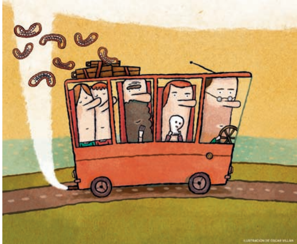
ILUSTRACIÓN DE OSCAR VILLAR