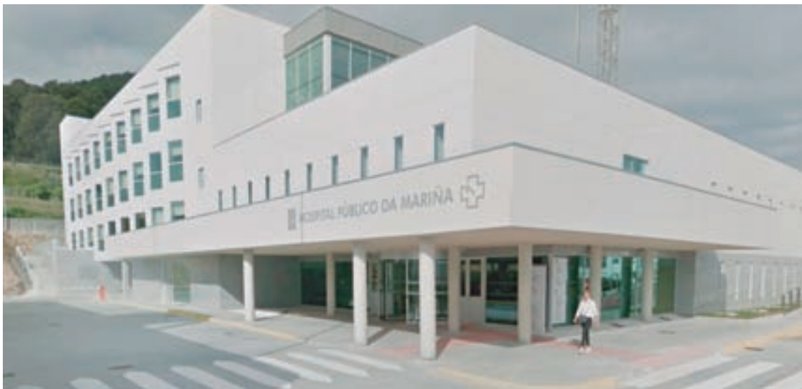
Hospital Público da Mariña localizado en Burela

Outros 31,4 millóns de euros serán para apostar pola Tarxeta Benvinda como apoio económico para as familias que teñan un fillo, e atenderanse a todas as solicitudes do Bono Concilia Familia. No ámbito da protección de menores, o orzamento incrementa os fondos ata os 6,5 millóns de euros para o acollemento familiar, e en