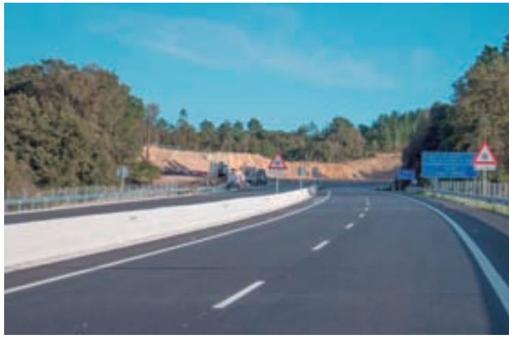
Primeiro tramo da autovía Nadela-Sarria

Con respecto ás partidas de Familia, Infancia e Dinamización Demográfica, estas soben ata os 242 millóns de euros e destínanse 3 para as ampliacións da rede de casas niño, mentres que outros 31,4 millóns serán para