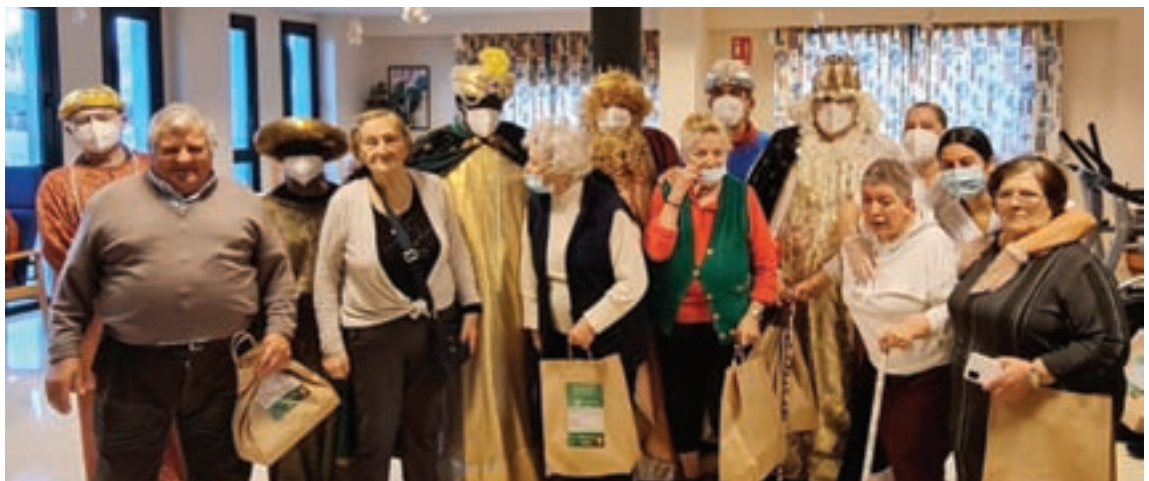
De arriba a abaixo e de esquerda a dereita: Dúas imaxes da aula de música tradicional que saíu a cantar os Reis pola vila e fixeron parada na residencia de maiores, dúas imaxes da Cabalgata de Reis de Sarria, o Apalpador visitando aos nenos do Ceip de Triacastela e os Reis Magos visitando a residencia de maiores do Incio