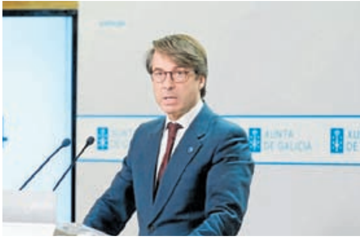
Miguel Corgos López-Prado, conselleiro de Facenda e Administración Pública

Segundo a plataforma SOS Sanidade Pública, "o orzamento sanitario aínda que crece un 4,2% respecto a 2023, como a inflación prevista e do 4,3%, na realidade decrece nun 2,3%". As deputadas autonómicas do PP na comarca de Lemos, din que "é un claro exemplo de que a Xunta continúa apostando pola continuidade deste centro sanitario", subliñan. Para a deputada do BNG "as inversións en Sanidade non parecen suficientes xa que as carencias na Atención Primaria ou tamén no Hospital de Monforte merecerían unha especial dotación". Segundo a plataforma SOS Sanidade Pública, "o orzamento sanitario supón unha renuncia a introducir as melloras que necesita a Sanidade Pública Galega para resolver os graves problemas que a afectan". E no gasto na Atención Primaria din que o "o gasto crecerá soamente en 56 millóns de euros, un 3,5% respecto ao 2023. Pois se descontamos a inflación o gasto descende realmente un 18,6 %. O gasto para Atención Primaria queda no 14,2% do total sanitario, moi lonxe