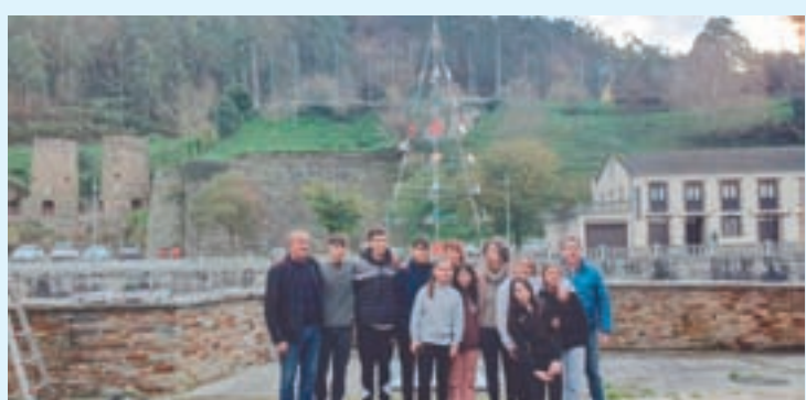
IES ENRIQUE MURUAIS. Este Nadal, A Pontenova estreou unha nova árbore que foi realizada polo alumnado de FP dual de soldadura e caldeiraría do Instituto Enrique Muruais.

mentos de choiva forte, a auga afecta as edificacións pegadas aos viais. As obras completaranse cunha nova pavimentación do firme dos accesos e camiños. O investimento total nas obras será de case 300.000 euros, "un contía moi importante para un Concello desas dimensións, que dificilmente podería levarse a cabo sen colaboración entre administracións", din dende o ente local, e, nese sentido, incidiu "no compromiso da Deputación con actuacións que contribúan a manter e mellorar infraestruturas e servizos imprescindibles para a calidade de vida da veciñanza". O convenio habilita ao Concello para comezar a executar as obras desde comezos do mes de xaneiro.