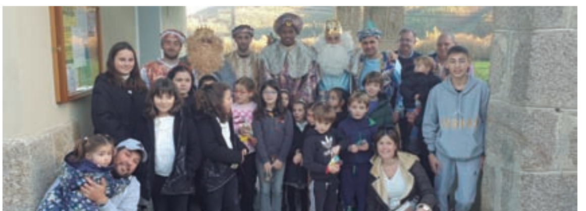
De arriba abaixo e de esquerda a dereita: decoración da Asociación O Atrio de Vilaronte de Foz, gala de Nadal de Xove, os autos de Vespa&Faba de Lourenzá, visita de Papá Noel e un boneco reciclado de Cervo, cabalgata de Reis en San Cibrao, nenos en actividades de Oourol, o Apalpador en Ribadeo, Papá Noel no Vicedo, tren infantil en Cervo, os Reis Magos en Mondoñedo e en Alfoz