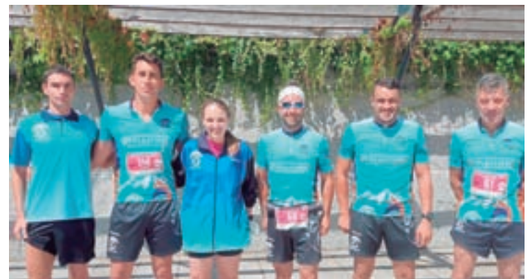
Compoñentes do Club Biosbardo que participou no III Trail Asaltamontes

CD Ceosport Lucense, e polo seu posto o noso club ADC Sacro Corazón como equipo anfitrión. Esta edición reunirá a un total de 36 equipos, 12 por categoría, e contará coa participación de preto de 700 xogadores. O torneo desenvolverase o venres 10 a categoría cadete, o sábado 11 a xuvenil e o domingo 12 a infantil.