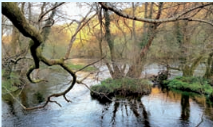
Un dos puntos de protección ambiental

Tres concellos da zona centro de Lugo, Outeiro de Rei, Castroverde e Guntín recibirán axudas como apoio nas tarefas de conservación, recuperación e rehabilitación do patrimonio natural e cultural e á sensibilización ecolóxica na súa reserva da biosfera Terras do Miño.