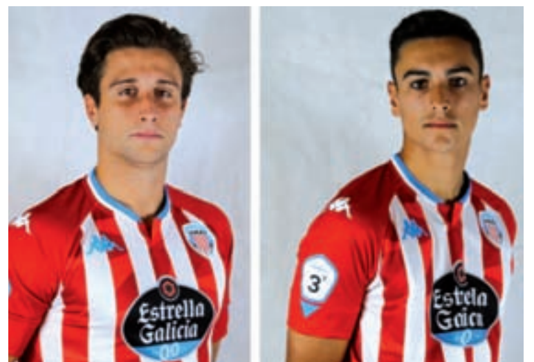
Arriba xogadores novos do Residencia e abaixo, dúas renovacións do Polvorín