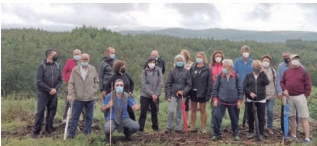
Un dos roteiros organizados polo colectivo

Haberá un límite de 24 prazas e terán preferencia os socios. Ademais contarán cun xantar nun lugar o máis axeitado posible. O prezo desta excursión é de 30 euros e o percorrido duns 10 quilómetros.