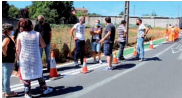
Os concelleiros nacionalistas, vistando os últimos traballos en Albeiros

A Rúa Xenebro pasará a ser de sentido único dende Rúa Illa de Ons ata a conexión coa vía de servizo da Ronda Norte (Garaballa de Arriba) e habilitárase unha banda de preferencia de uso peonil na marxe dereita, que continuará no treito da vía de servizo da Ronda Norte dende a glorieta (Garaballa de Arriba ata o CEIP Albeiros), percorrendo a mesma dende a Ronda Norte ata o CEIP Albeiros.