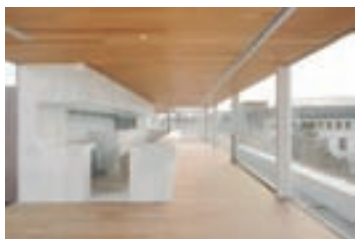
Imaxe do proxecto da cafetería

O Concello sacará a licitación, nas vindeiras semanas, o contrato para a xestión da cafetería do Vello Cárcere. A área de contratación última a redacción dos pregos, actualizados para adecuarse non só ás inxerencias do sector senón tamén á nova situación de pandemia.