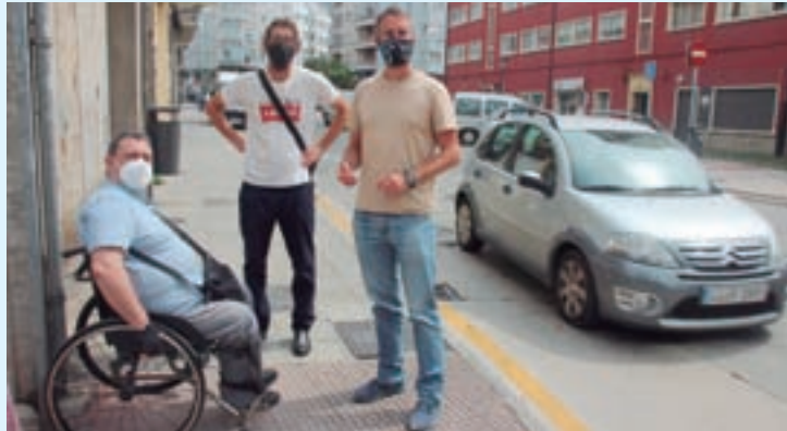
Os concelleiros nacionalistas, na zona de Lamas de Prado