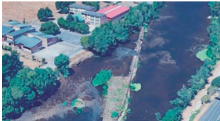
Caneiro do Muíño

O popular sinala que esta é a mellor época para levar a cabo estes traballos, “tanto polo nivel do río como da estación na que nos atopamos xa que o arranxo debe facerse antes de que chegue o mal tempo e aumente o caudal do río”. O concelleiro popular urxe á reparación do caneiro de O Muíño, “sobre todo tendo en conta que hai semanas que se coñeceu o fallo xudicial que revertía a titularidade deste caneiro de novo á Confederación Hidrográfica Miño-Sil, polo que dende a Confederación de Infraestruturas. Para a realización xa non teñen ningún tipo de escusa para non reparalo”. Sinala