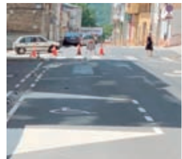
A rúa Marqués de Ombreiro

Froito desta xuntanza, acordouse tamén realizar o repintado de Marqués de Ombreiro que pasou a ser dun único sentido de circula-