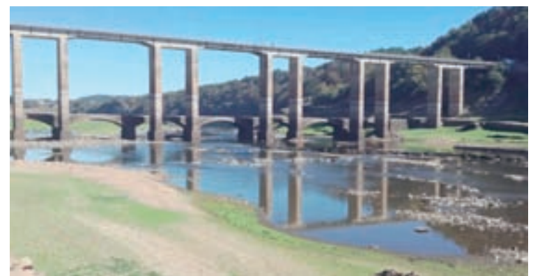
Imaxe do baixo nivel do río ao seu paso por Portomarín

Ademais, no ximnasio procederase á reparación de paramentos, a renovación do zócalo interior e a substitución da porta de acceso. No pavillón levaranse a cabo tarefas de mantemento e limpeza de canlóns e baixantes e incrementarase a altura da varanda existente para evitar riscos de caídas