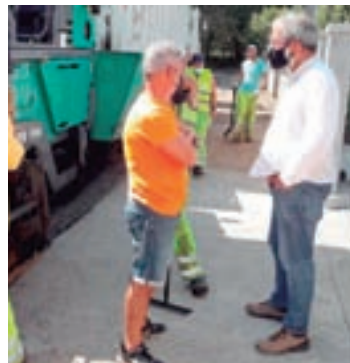
Obras das Gándaras

A área de Infraestruturas está a actuar nas rúas Vagalume, Bolboretta, Paporrubio, Galo, Gaivotas, Toledo, Areas, Rola, Camiño de Gustavo e Pombo, ademais dos ramais de acceso da rúa da Rola á Avenida Adolfo Suárez, Bolboretta a Monte Pía Páxaro e Adol-