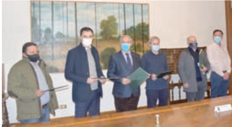
Firma do Plan Ilumin@ cos representantes dos concellos

A Deputación rematou a execución de case o 75% do Plan Ilumin@, un programa dotado con 723.000€ co que a institución provincial axuda aos concellos da provincia a aforrar custes enerxéticas. Do total do investimento, o 80% son fondos europeos que a Deputación conseguiu a través do IDAE (Instituto para a Diversificación e o Aforro da Enerxía), un organismo dependente do Ministerio de Transición Ecolóxica. Xa son 28, dos 38 concellos que decidiron adherirse a este programa, os que teñen as actuacións completadas, consistentes na substitución de luminarias públicas por outras máis eficientes. Os contratos de subministro e instalación de material que inclúe o plan Ilumin@ está dividido en zona norte, centro e sur. O 100% da zona centro está rematada, mentres que na zona norte 11 dos 14 concellos xa se benefician do programa e un, Burela, está rematado, pendente de certificar. Pola súa banda, cinco concellos da zona sur xa teñen o plan Ilumin@ completo e os 7 restantes