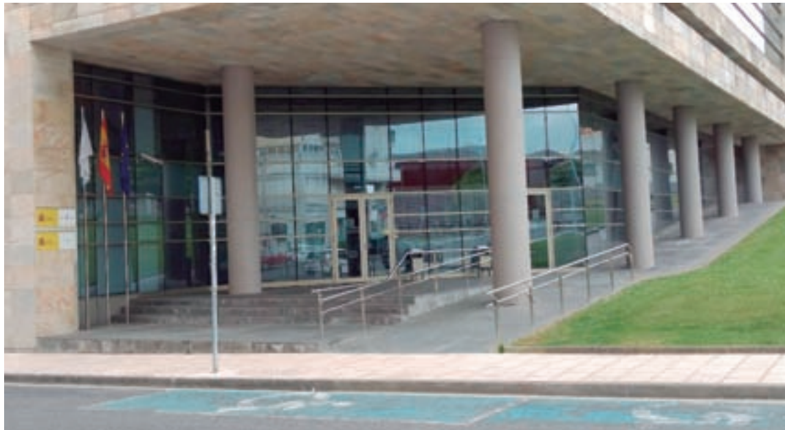
Rampla de acceso e prazas reservadas no edificio da Tesourería Xeral da Seguridade Social

No caso da accesibilidade pública, case todo o público é accesible. De feito, un dos plans que axuda para esta cuestión son as obras de peonalización, nas que se conseguen