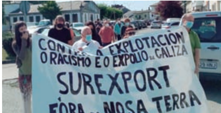
Manifestación en Castro de Rei

Afirman que xa pasaron varios días deste gravísimo suceso, “e nin dende a empresa nin dende a Consellaría