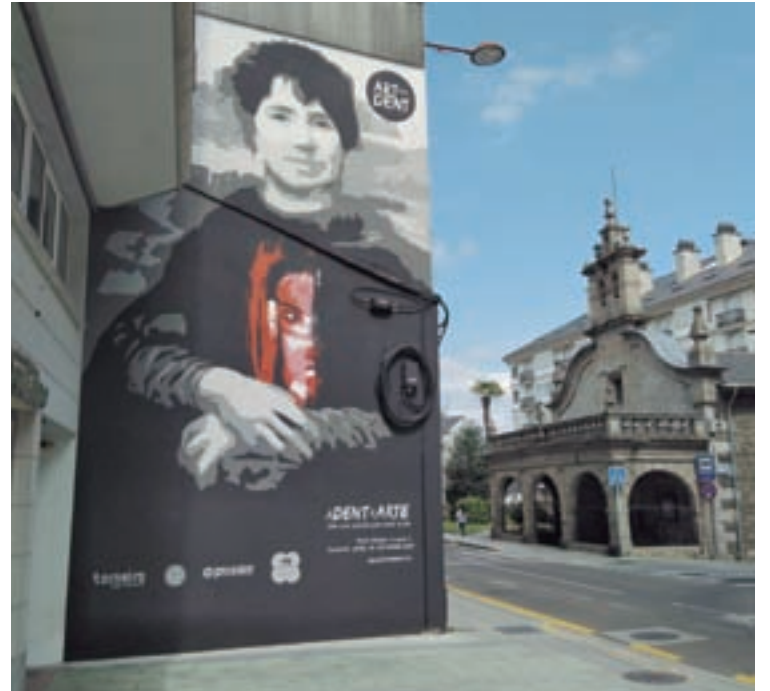
Novo mural fronte á capela de San Roque

A Asociación Galega da Enfermidade de Dent foi creada por 4 familias galegas, de Lugo, Muros, Brión e Pontevedra afectadas por esta enfermidade. O proxecto Art For Dent naceu a comezos do ano 2020, e pretende abrir unha nova vía de colaboración e financiación desde Galiza para investigar a enfermidade de Dent, ademais de darlle visibilidade a esta enfermidade rara.