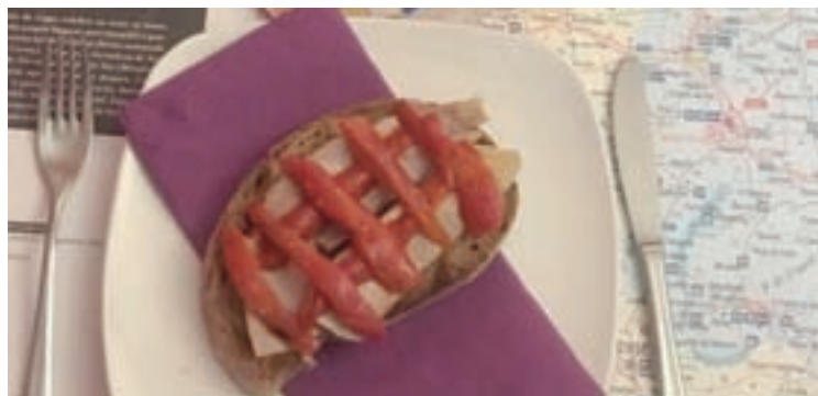
Unha tapa dunha das edicións anteriores

de tapas de Lugo estarán abertas entre o 1 e o 15 de setembro. Entre o 5 e o 21 de novembro os locais participantes ofertarán as súas tapas a todas as persoas que o desexen, que exercerán de xurado popular para escoller a tapa gañadora do concurso e