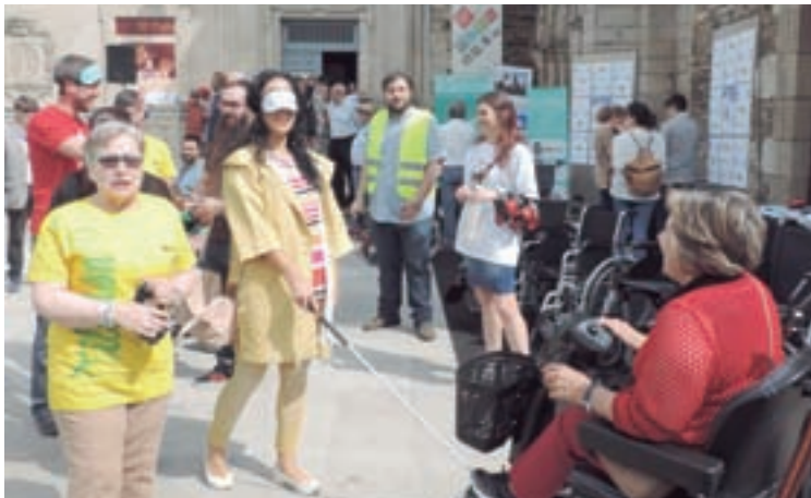
Arriba, a rampla da praza da Constitución e os concelleiros facendo unha simulación de invidencia

de tiña que ser dende un primeiro momento un plan xeral e, unha das vías para facelo, era desenvolvendo unha ordenanza municipal de accesibilidade.