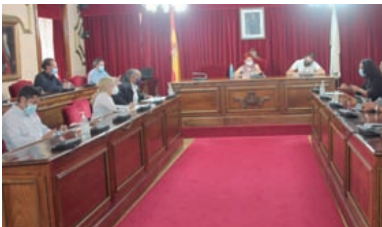
Imaxes do recinto feiral e da comisión de festas na última reunión