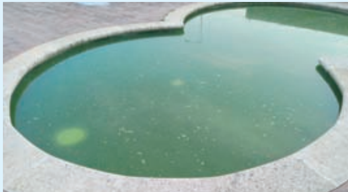
Estado da piscina infantil