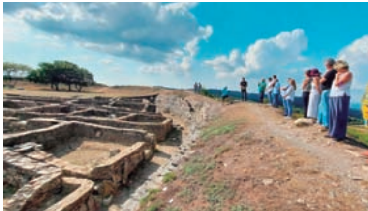
Poboado de Castromaior

CONSOLIDACIÓN DE MUROS E RÚAS. Durante estes dous últi-