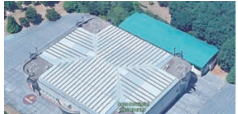
O pavillón anexo atópase na parte traseira do Pazo dos Deportes

O PP insta ao goberno provincial a dotar de aseos, duchas e vestiarios ao pavillón anexo do Pazo dos Deportes, no que adestran e compiten centos de nenos e xoves lucenses.