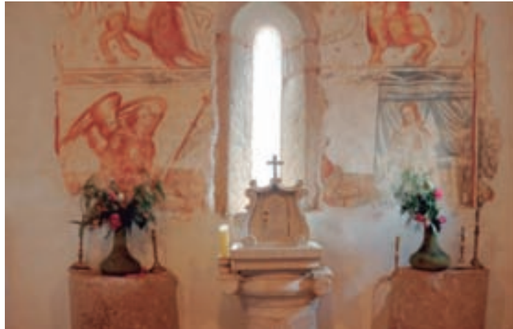
Á esquerda, unha imaxe do interior da igrexa e, á dereira, pegadas na pedra anexa á porta