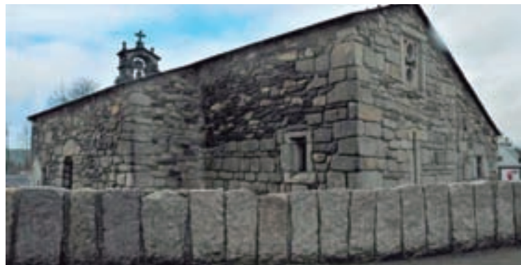
Exterior da igrexa parroquial de Santo Tomé