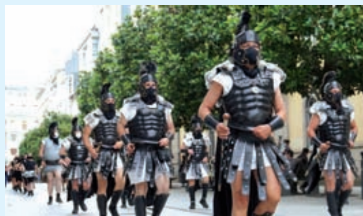
Unha das asociacións de recreación histórica de Lugo

A Xunta de Goberno aprobou a concesión directa das subvencións nominativas, así como a aprobación dos convenios que o Concello de Lugo mantén coas entidades que desenvolven a súa actividade no eido dos Servizos Sociais.