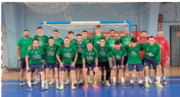
O equipo do Ribeira FS sénior