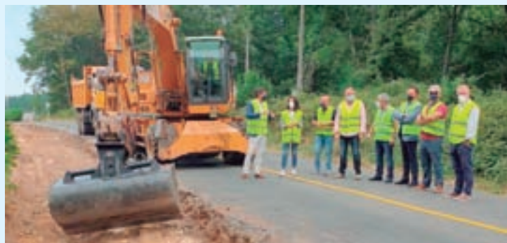
Visita do alcalde ás obras

Comezou a primeira fase das obras de mellora da estrada autonómica LU-231 entre Friol e Palas de Rei, ás que destinan 2,8 millóns de euros. Os traballos teñen un prazo de execución de 12 meses.