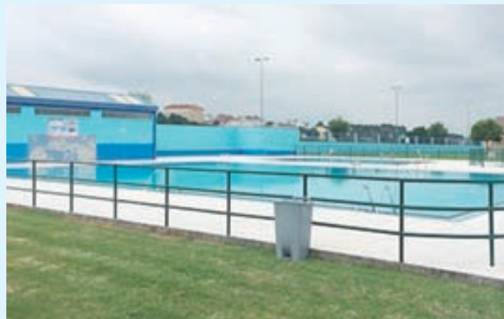
Instalacións de Frigsa

A área de Deportes manterá aberta a piscina exterior de Frigsa até o vindeiro 15 de setembro, ampliando nunha quincena o que viña sendo o seu período de funcionamento habitual.