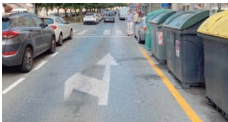
Contedores na avenida Fontiñas de Lugo

Ameijide explica que se ve na obriga de pedir esta normativa xa que no municipio hai moitos puntos nos que a visibilidade “é practicamente nula” nas inmediacións dos pasos de peóns xa que se permite o aparcamento ou a colocación de colectores do lixo xusto antes do paso, polo que os condutores teñen moi difícil ver se hai peóns dispostos a cruzar, do mesmo xeito que os peóns non poden ver se hai vehículos circulando. O concelleiro popular reclama algo tan sinxelo como que se elabore unha normativa municipal con criterios de localización para o mobiliario urbano ou outro tipo de elementos, así como para garantir a visibilidade previa a pasos de peón e cruces, para evitar que se permita o esta-