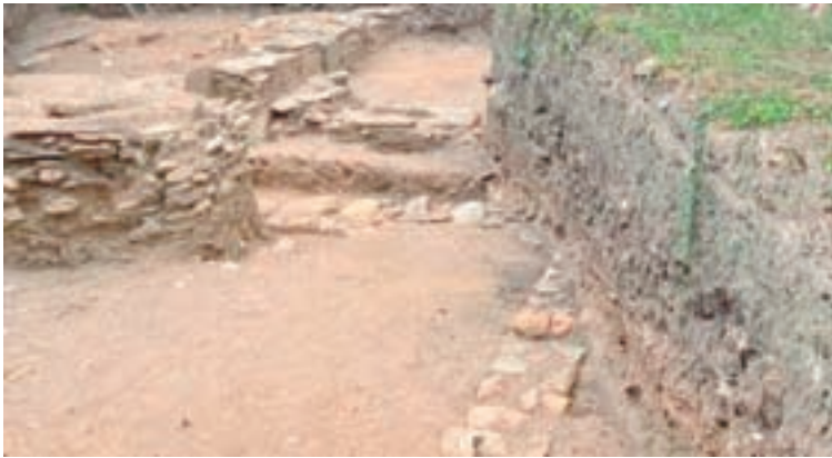
Cata arqueolóxica no Carme

Lugo organiza para setembro novas visitas guiadas ás catas arqueolóxicas do barrio do Carme, co obxectivo de dar a coñecer o patrimonio histórico e cultural desta zona da cidade, pola que discorren, ademais, o Camiño Primitivo de Santiago e a Vía Romana XIX.