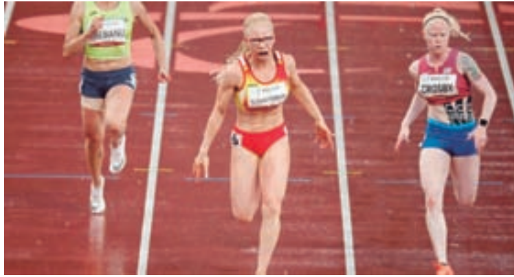
A atleta lucense, entrando na liña de meta en Tokyo

Despois de acadar dúas pratas (100 e 200 metros) no Mundial de Dubai hai dous anos, así como a dobre coroa en 100 e 400 metros no Europeo,