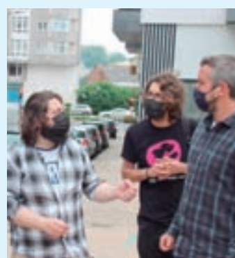
Reunión no barrio da Residencia

Nos últimos dous anos a área de Mobilidade e Infraestruturas renovou o alumbeado en múltiples zonas da cidade, instalando novas luminarias en rúas como a avenida Filharmónica Lucense, que non contaba con alumbeado público, e