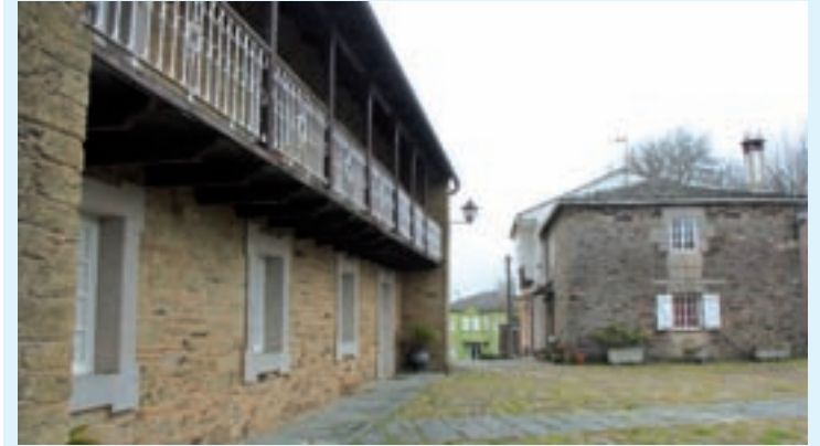
Vista do centro histórico de Castro de Rei

Por primeira vez Castro de Rei e Guitiriz entran no reparto de fondos destinados a financiar distintos tipos de actuacións de recuperación e urbanización nas áreas de rehabilitación integral (ARI).