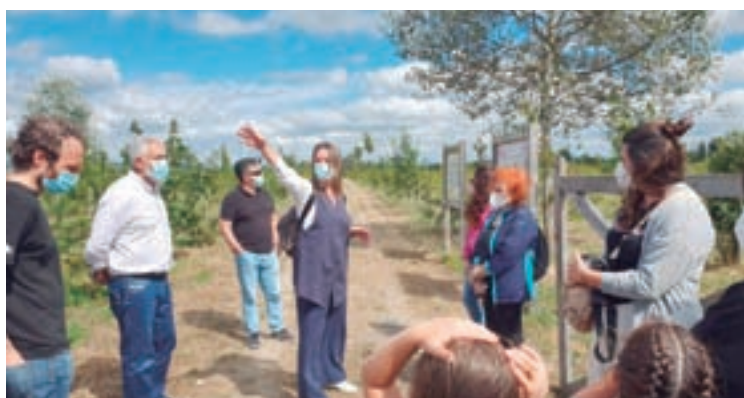
Unha das visitas guiadas ao bosque urbano

Haberá unhas xornadas de portas abertas que terán lugar, igualmente, todos os venres, sábados e domingos en horario de 9.30 a 19.30 horas. Tamén celebraranse obradoiros dirixidos ao público infantil, que incluírán un contacontos musical e unha visita ao bosque urbano mentres se