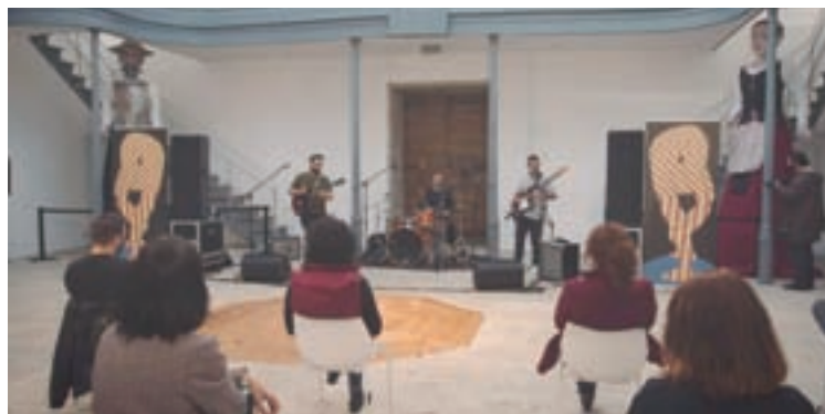
Anterior edición dun concerto paralelo ao Encontro de Fanzines

"Durante dous días Lugo acollerá unha feira do fanzine e da autoedición, unha reunión pública e aberta a todas as persoas interesadas nas publicacións independentes e autoxestionadas", explicou o tenente alcalde, que engadiu "con esta iniciativa queremos abrazar o amateur e abrir as portas ás creadoras de Lugo que aínda non se