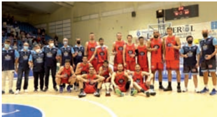
O equipo, tras gañar a Copa Galicia