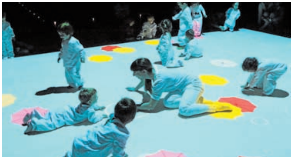
Á esquerda, á lectura do pregón e dúas imaxes dos mercadiños da praza Maior e San Marcos. Á dereita, unha actividade infantil, o acendido do alumeado e unha obra de teatro para os máis pequenos