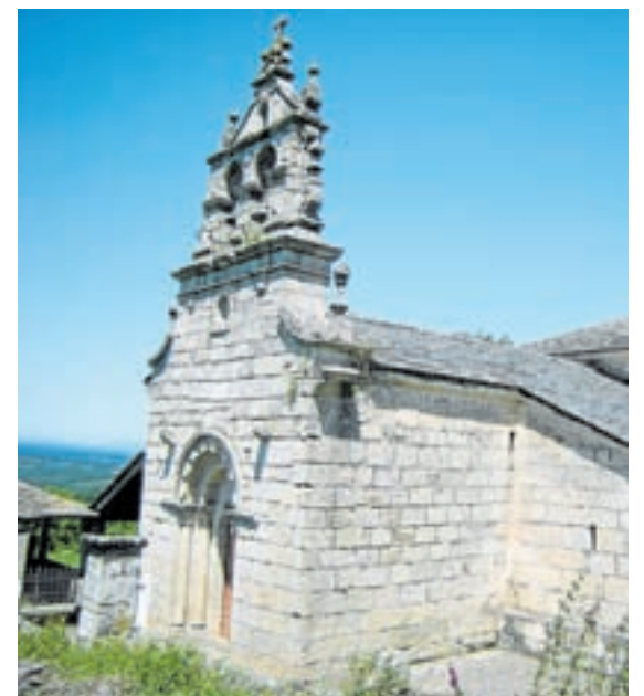
De arriba abaixo e de esquerda á dereita: igrexa de San Vicente de Gondrame, a de San Salvador de Vileiriz, a de Santo Estevo de Grallás e a de San Xoán de Friolfe