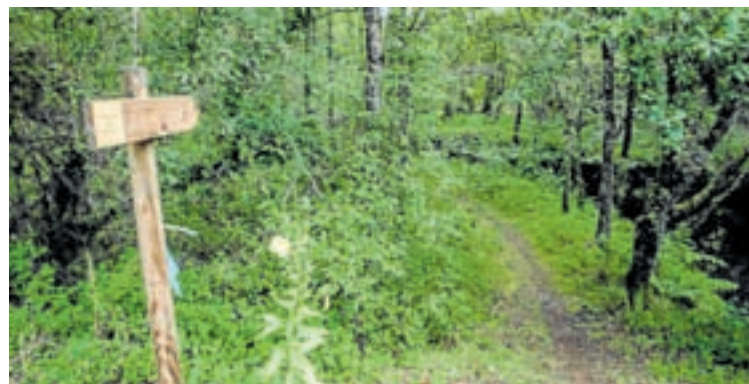
Unha vista dun dos roteiros de Xermade

O proxecto de posta en valor e promoción da Reserva da Biosfera Terras do Miño no Concello de Xermade obtivo o aval do órgano xestor da