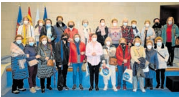
Presentación do programa Coñece a túa provincia

Poden optar a esta convocatoria todas aquelas empresas de calquera sector, asociacións e outras entidades sen ánimo de lucro da provincia de Lugo que queiran incorporar no seu equipo a mozos para prácticas non laborais e que firmen un convenio co Servizo Público de Emprego con esta finalidade.