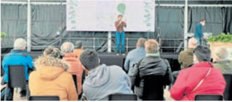
Presentación dos resultados do estudo