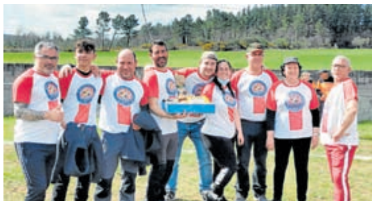
Os Troitas Bravas foron os gañadores por equipos

Aló vai xa máis de media tempada e semella que non hai un claro dominador. Os que comandan a clasificación están nun sube e baixa continuo. Xornada a xornada os dez ou doce primeiros intercámbianse os postos. Sirva como mostra que foron cinco xogadores distintos os que nas sete xornadas que van disputadas se turnaron no alto da clasificación e todos teñen