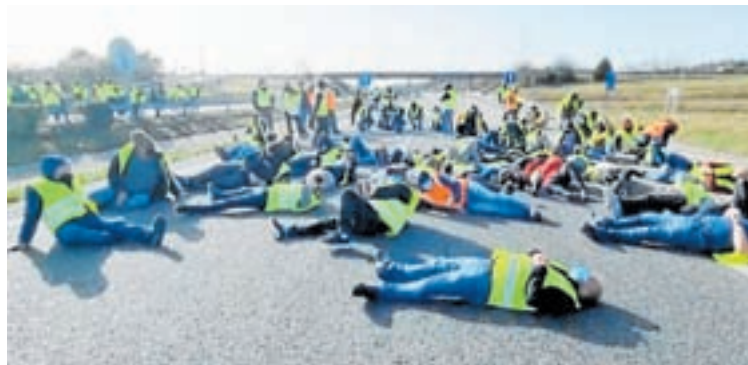
Os transportistas cortaron a A-6 á altura de Guitiriz

O Goberno aplicará unha rebaixa de 15 céntimos e as petroleiras un mínimo de 5 céntimos, aínda que