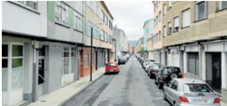
A rúa Cabanas no seu estado actual

Por último, co obxectivo de mellorar a calidade de vida da veciñanza, creárase un espazo de lecer que incluírá un parque infantil, un parque biosaludable e un espazo de reunión. Os traballos rematarán coa plantación de especies arbóreas e a instalación de mobiliario urbano (bancos, xardineiras e papeleiras) e a sinalización horizontal e vertical do viario.