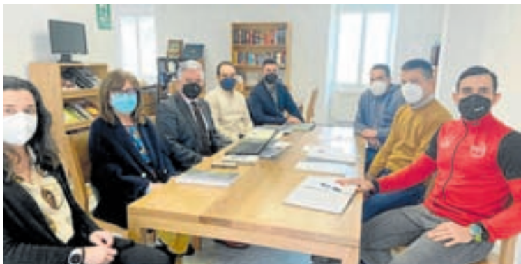
Reunión dos representantes do Catastro cos dirixentes de Muras