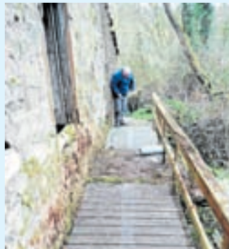
Obras nunha das pontes

Un total de 15 persoas participaron nestes labores sen ánimo de