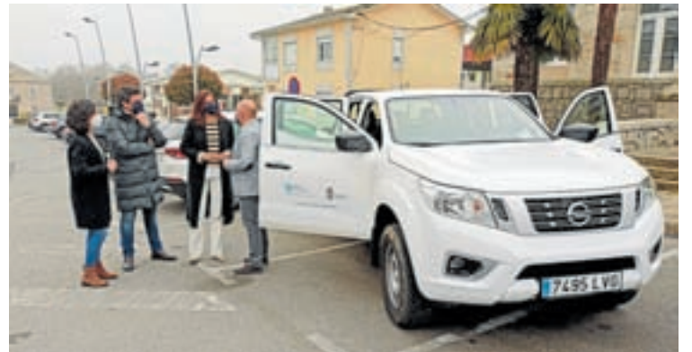
O novo vehículo do Concello de Friol

A Xunta apoiou ao concello de Friol na compra dun vehículo todoterreo para o servizo de medio ambiente e extinción de incendios. E tal e como indicou a directora xeral o concello carecía de vehículo co que prestar os servizos e medioambiente e extinción de incendios, xa que a brigada ambiental do Concello de Friol contaba cun único vehículo para as tarefas de xestión da biomasa vexetal, limpeza de camiños, das faixas auxiliares e control de residuos, o cal tivo importantes avarías, deixan-