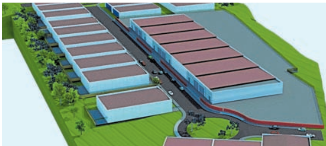
Proxecto do polígono de Muras, que leva parado desde hai varios anos

O BNG, pola súa parte, levou ao Parlamento unha iniciativa para reformar a Lei de Inclusión Social pola “falta de impulso legislativo da Xunta, un síntome claro dun Goberno en decadencia”. E o PSdeG defende que