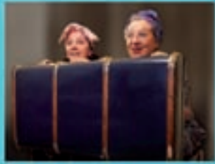
Libú Teatro Madness