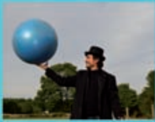
Señor López Produccións A viaxe do Señor López