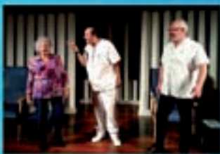
Teatro do Miolo Arando do germe