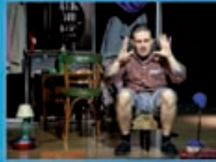
Itaca Teatro Formigas no peito