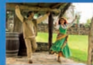
Xamón Producción Maria Balteira