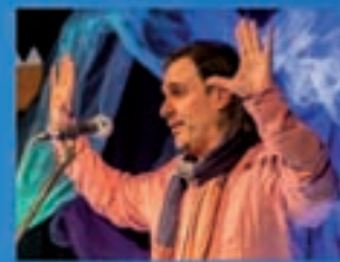
Itaca Teatro Anacos