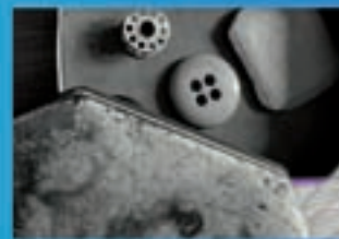
Loia Produccións El Visitation Consolación Receitas