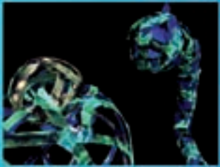
Microteatro Titeres Alas de Gardón