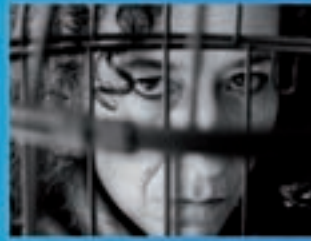
Bodega Teatro O Pano