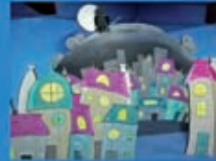
Libú Teatro O vixilante dos soños