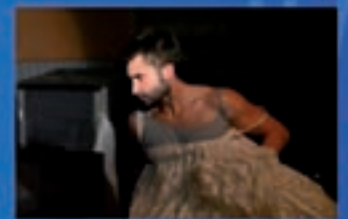
Baixo da area Teatro Poeta en Nova York