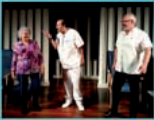
Teatro do Miolo Arando do Germe