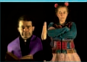
Bodega Teatro O mundo de Bertina