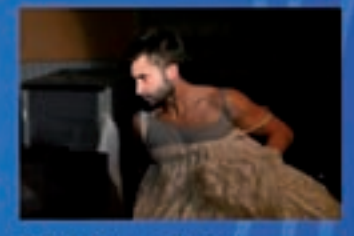
Baixo da area Teatro Poeta en Nova York