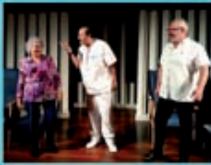
Teatro do Miolo Batada do Cerro