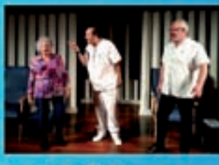
Teatro do Miolo Batada do Cerro