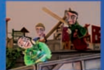
Trécola Produccións Coa música a outra parte