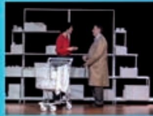
Ítaca Teatro Ósco minutos sen respirar