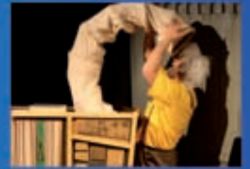
Trécola Produccións Monstrólogo