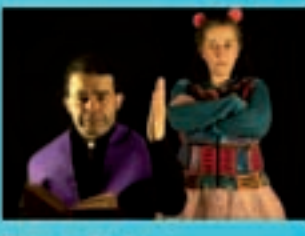
Batega Teatro O mundo de Martiño