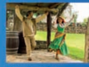
Xamón Producción María Balteira