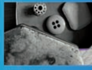
Loia Produccións #Visitación Consolación Acoltra