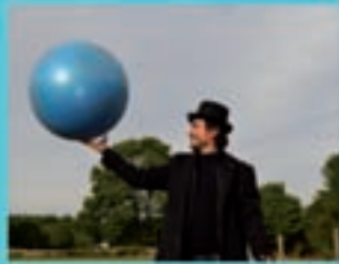
Señor López Produccións A viaxe do Señor López