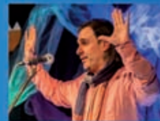
Ítaca Teatro Anacos