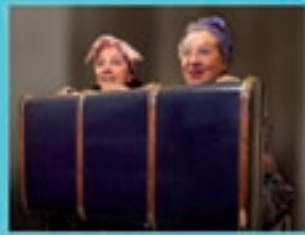
Ubu Teatro Madrugas