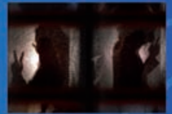
Satori Teatro Masculino singular