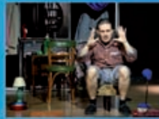
Ítaca Teatro Formigas no peito