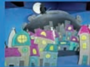
Ubu Teatro O vigiante dos soños