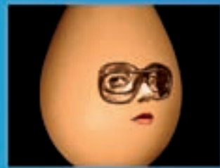
Lilã Teatro Para Avis